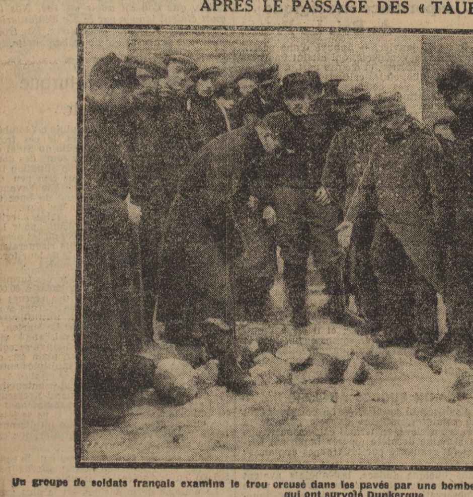
Un groupe de soldats français examine le trou creusé dans le pavé par une bombe lancée par un des avions allemands qui ont survolé Dunkerque