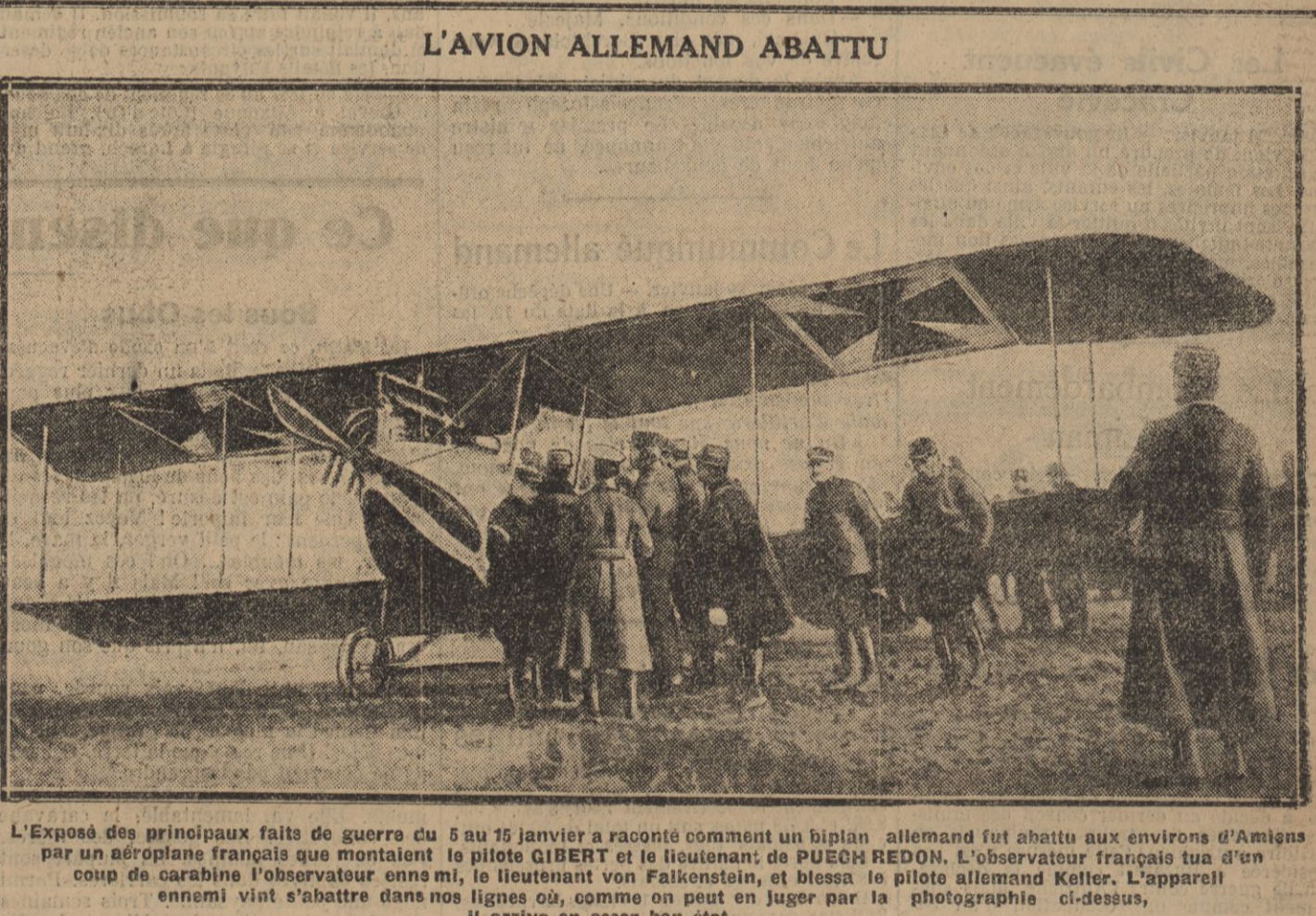
L'Exposé des principaux faits de guerre du 15 au 16 janvier a raconté comment un avion allemand fut abattu aux environs d'Amiens...