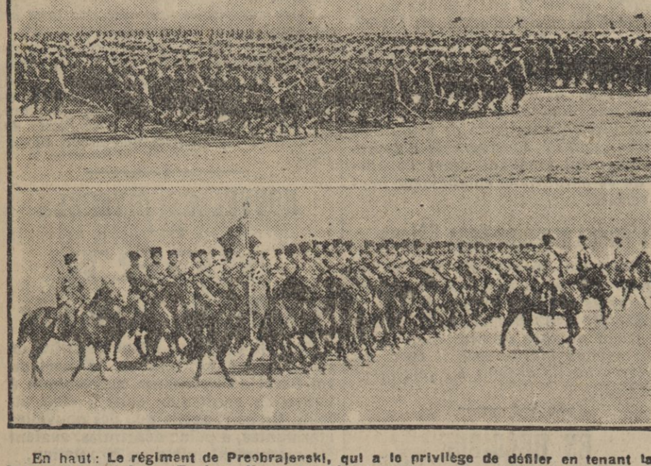
En haut: Le régiment de Preobrajenski, qui a le privilège de défiler en tenant la balonnette oroliste. — En bas: Une sotnia de cosaques.

feuilleton de LA PETITE GIRONDE du 10 octobre 1914. (14) La Frontière Par Maurice LEBLANC. — Possible, prononça Moresal. Cette pauvre Suzanne, elle n'a pas l'air très gai. Alors, décidément, tu la mènes ?