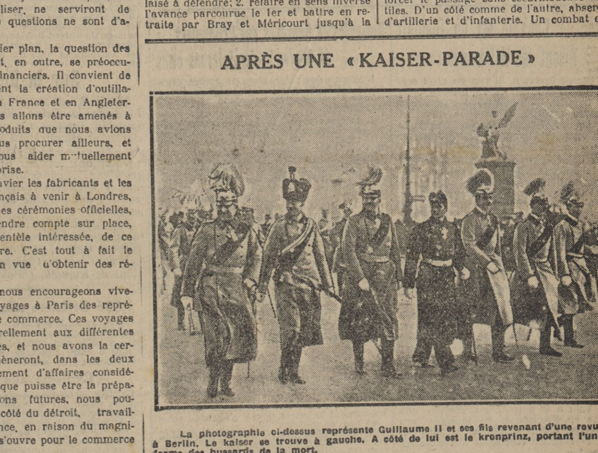
La photographie ci-dessus représente Guillaume II et ses fils revenant d'un voyage à Berlin. Le Kaiser se trouve à gauche. A côté de lui est le kronprinz, portant l'uniforme des hussards de la mort.