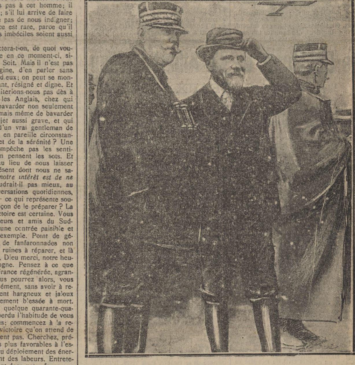
M. Poincaré et le Général Joffre.