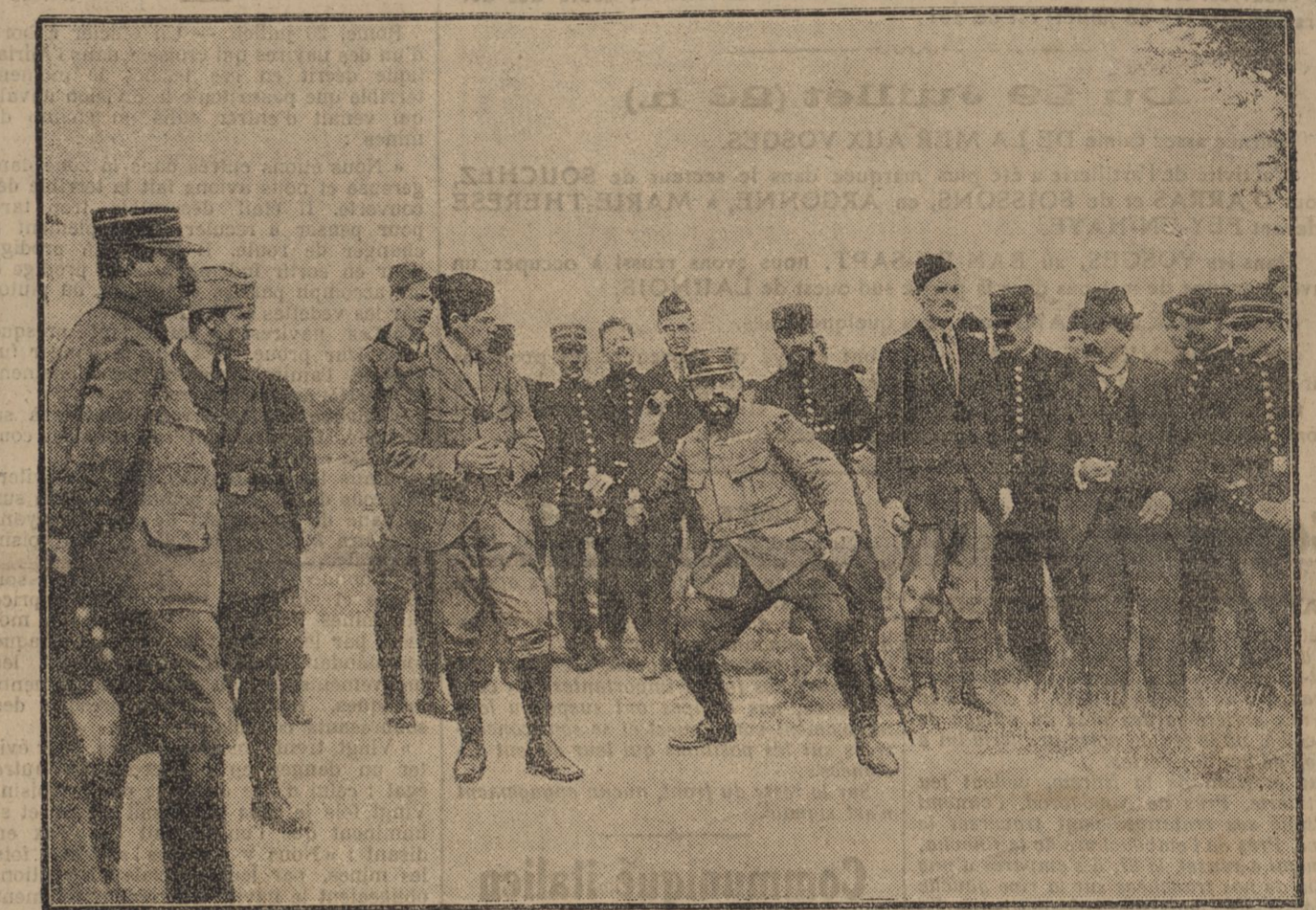
EXPERIENCE DE LANCERMENT DE LA GRENADE