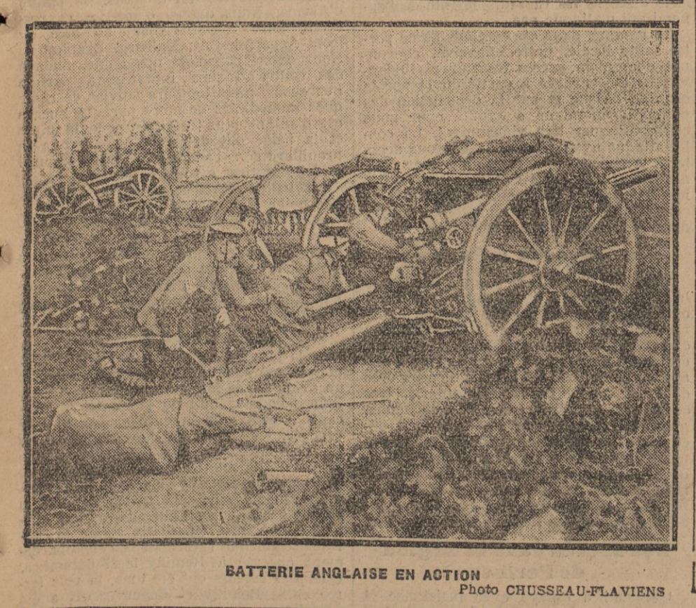
BATTERIE ANGLAISE EN ACTION