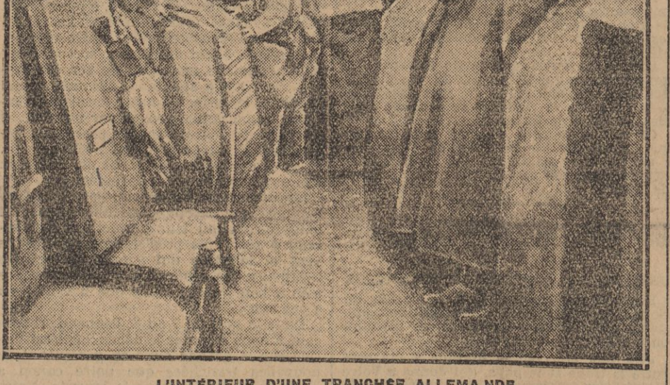
L'INTERIEUR D'UNE TRANCHÉE ALLEMANDE