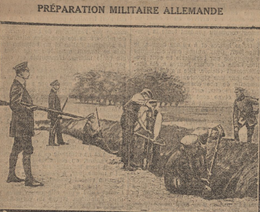
PREPARATION MILITAIRE ALLEMANDE