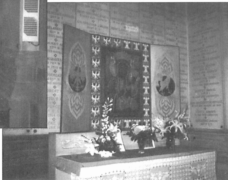
Autel et Chapelle de la Vierge Noire, dans le Mémorial de Notre-Dame de Lorette