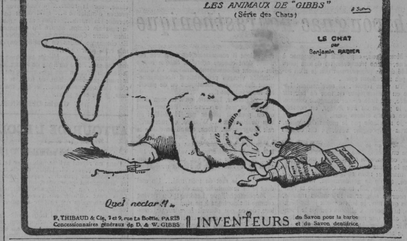
LES ANIMAUX DE "GIBBS" (Série des Chats)

N'hésitez pas, n'attendez pas qu'il soit trop tard; Pas demain, mais aujourd'hui même, recourez de suite aux COMPRIMÉS DE NUXYL NOBEL