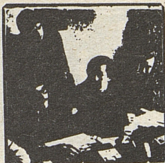
COLUMNA DEL C.C.