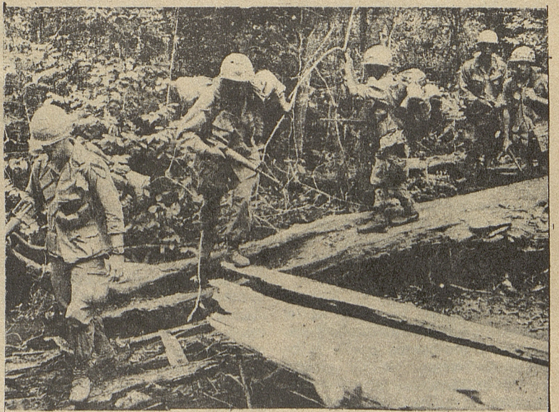
Una de las últimas unidades de tierra yanqui combatiendo en Vietnam.

Ese mismo cuadro en Vietnam, completado con el proceso electoral yanqui y el reajuste de la economía neocapitalista, es lo que explica la voltereta diplomática de Nixon, que algunos periodistas tratan de explicar