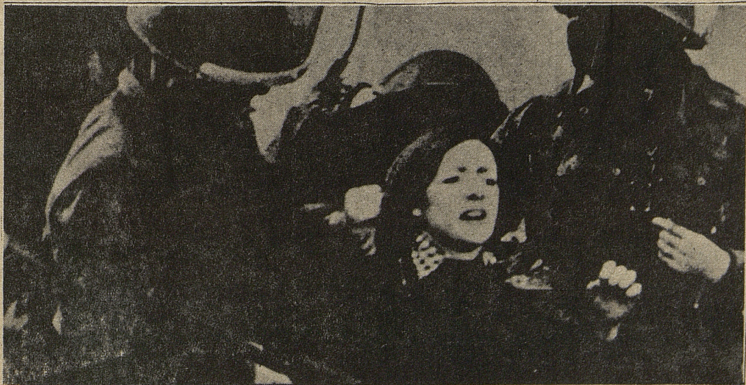
IRLANDA: La siniestra política imperialista es mantenida por los paracaidistas ingleses.

Sólo un sólido partido revolucionario puede garantizar que el ascenso de los explotados chilenos no termine en una grave derrota; impulsando organismos de base capaces de canalizar la movilización obrera y campesina y dirigiendo el indispensable trabajo político sobre las fuerzas armadas que garantice que, en el momento decisivo, suboficiales y tropa se vuelquen del lado de las masas.