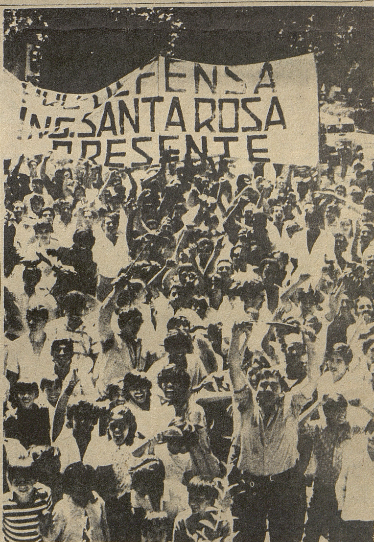
MOVILIZACION EN EL INGENIO SANTA ROSA: Al GAN le resulta difícil dar solución a la crisis económica argentina. Eso le reduce a Lanusse el margen de maniobra.

No nos quedan dudas entonces de que la tarea más urgente es lograr un frente obrero y socialista que encabece la lucha contra los principales sostenes y cómplices del GAN: el gobierno, Perón y la burocracia sindical, y contra otra variante burguesa.