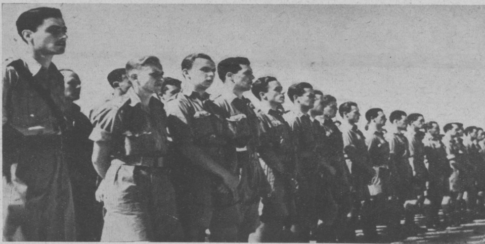
Podchorążowie na uroczystości promocji