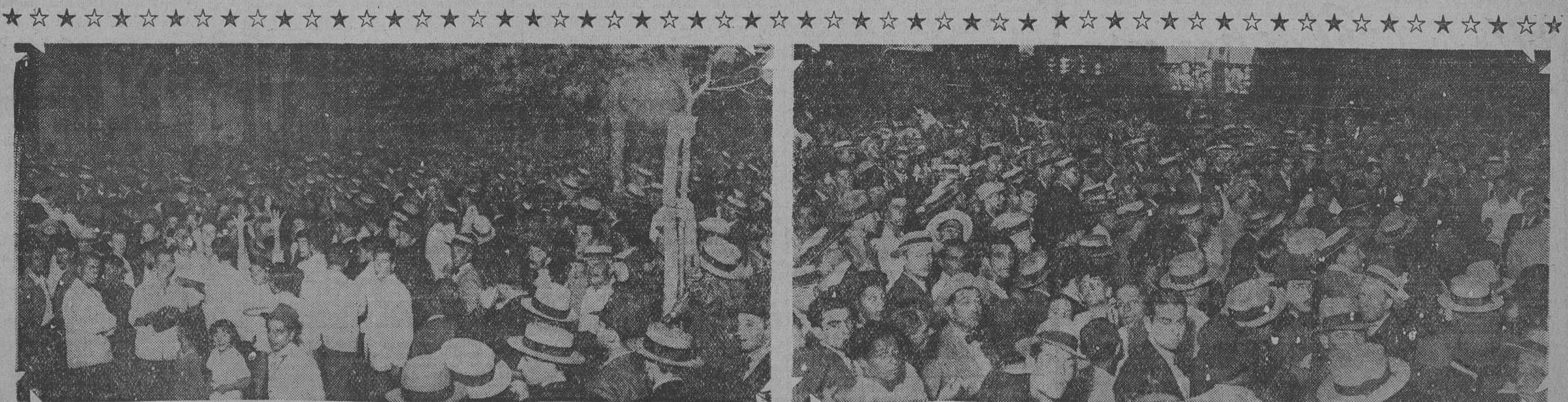
ALCANZARON UN EXITO EXTRAORDINARIO LOS CINCO MITINES REALIZADOS ANOCHE POR EL PARTIDO CLAUSURANDO LA PROPAGANDA ORAL, EN VARIAS SECCIONES DE esta ciudad. A la hora anunciada para la iniciación de los actos, verdaderas multitudes — como puede apreciarse en las notas gráficas que publicamos — habíase congregado alrededor de la tribuna y en un ambiente de cálido entusiasmo los oradores pronunciaron los discursos, rubricando el público sus expresiones con grandes aplausos. Por el entusiasmo observado y el número de asistentes, más de diez mil en cada acto, los mitines de ayer en las importantes barriadas obreras de la Boca, Patricios, Boedo, Villa Crespo y Villa Urquiza, constituyen un claro exponente del poderío de nuestro partido y un anticipo del clamoroso triunfo que alcanzará el socialismo en los comicios del 4 de marzo. Las notas gráficas corresponden a las reuniones de: a la derecha, Almirante Brown y Pérez Galdós. A la izquierda, Boedo y San Ignacio.