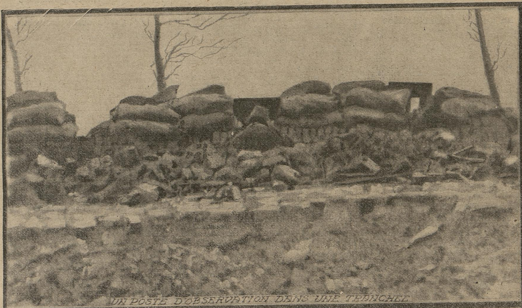
UN POSTE D'OBSERVATION DANS UNE TRANCHEE