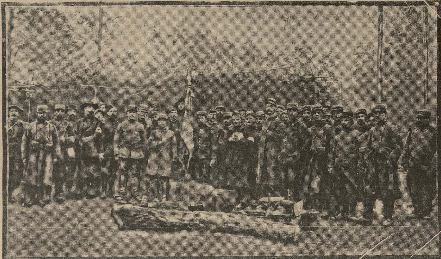
Les bleus de la classe 14 viennent d'arriver au front, et, sans tarder, ils ont été prendre leur poste de combat dans un coin de la forêt d'Argonne. Blessé au cours d'un précédent engagement, le colonel du régiment a tenu à présenter aux jeunes le drapeau que leurs anciens ont toujours conduit à l'honneur. Dépouillé de sa gaine de cuir, le glorieux trophée est apparu aux yeux de tous ces vaillants, qui brûlent du désir de voler sur les traces de leurs aînés.