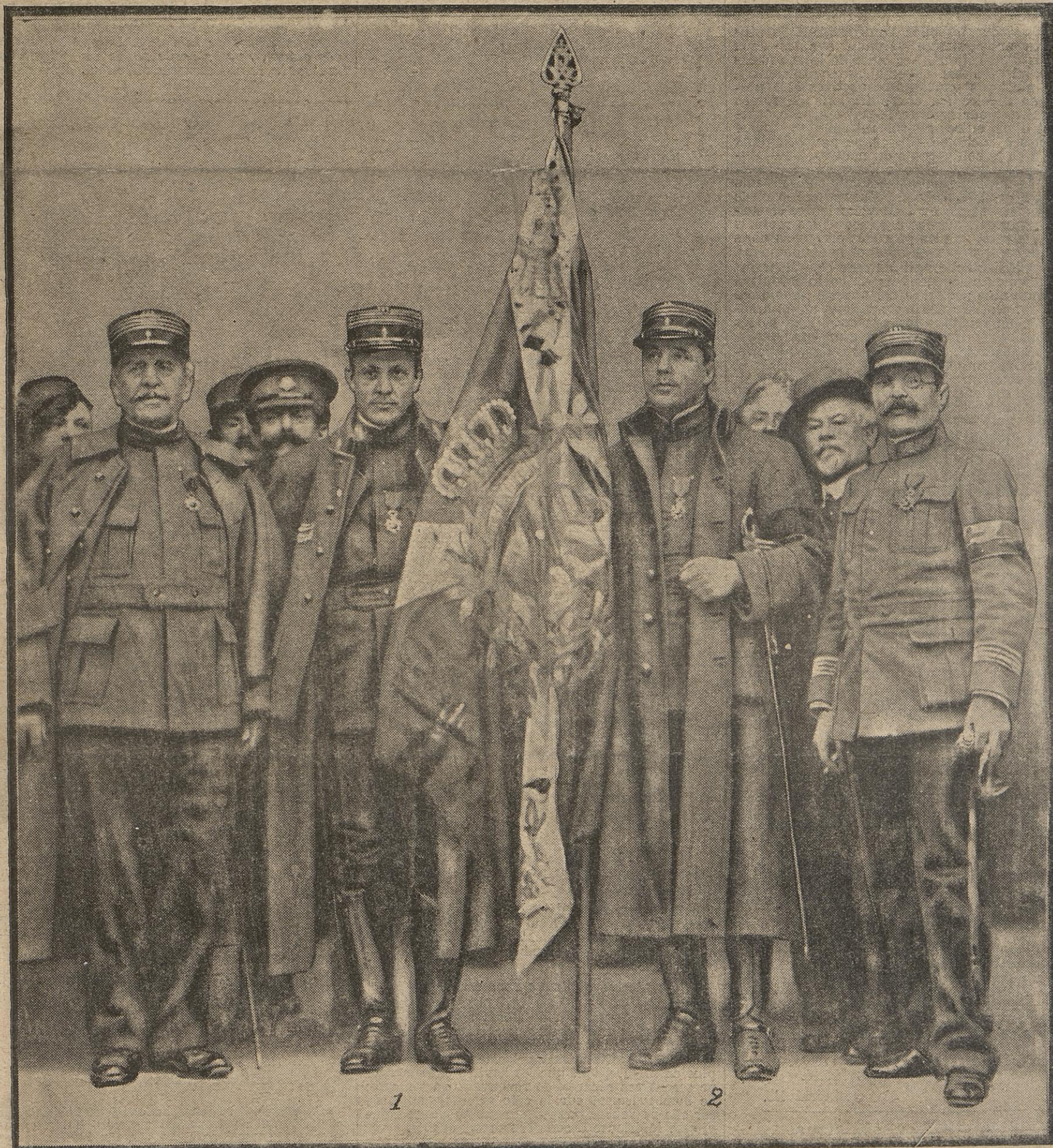
Le colonel Peppino Garibaldi (1) et son frère, le capitaine Ricciotti Garibaldi (2), sont venus, hier matin, visiter le Musée de l'Armée, aux Invalides. Le général Niox a ménagé aux deux brillants officiers une chaleureuse réception. On a présenté au colonel et au capitaine Garibaldi le drapeau allemand pris en 1870 par leur glorieux grand-père, Giuseppe Garibaldi. C'est ce trophée que nous reproduisons ici.