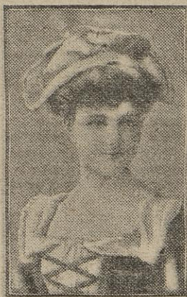
M lle DUSSANE

« Deux sous de sourire » et tout est facile ; « deux sous de sourire », et tous les mauvais nuages sont dissipés. J'ai bien souvent et bien profondément songé