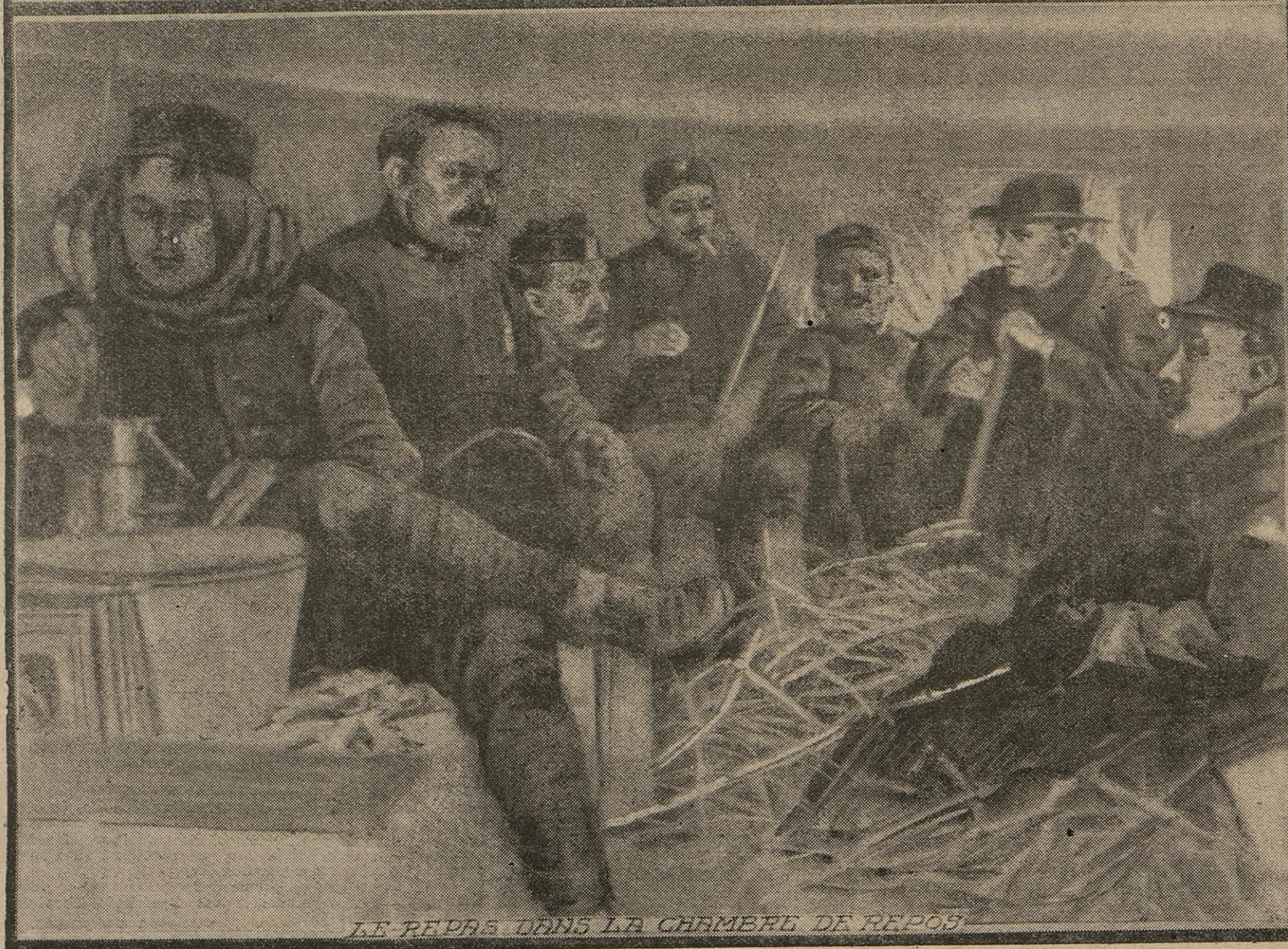
LE REPAS DANS LA CHAMBRE DE REPOS

En bordure d'une route, des retranchements ont surgi soudain. Nos sapeurs ont creusé le sol; ils ont édifié un mur, et derrière des créneaux solidement abrités nos fantassins surveillent tous les mouvements de l'ennemi. Aux alentours il n'y a plus une maison debout, et c'est dans les caves qu'officiers et soldats doivent s'installer pour faire leur popote.