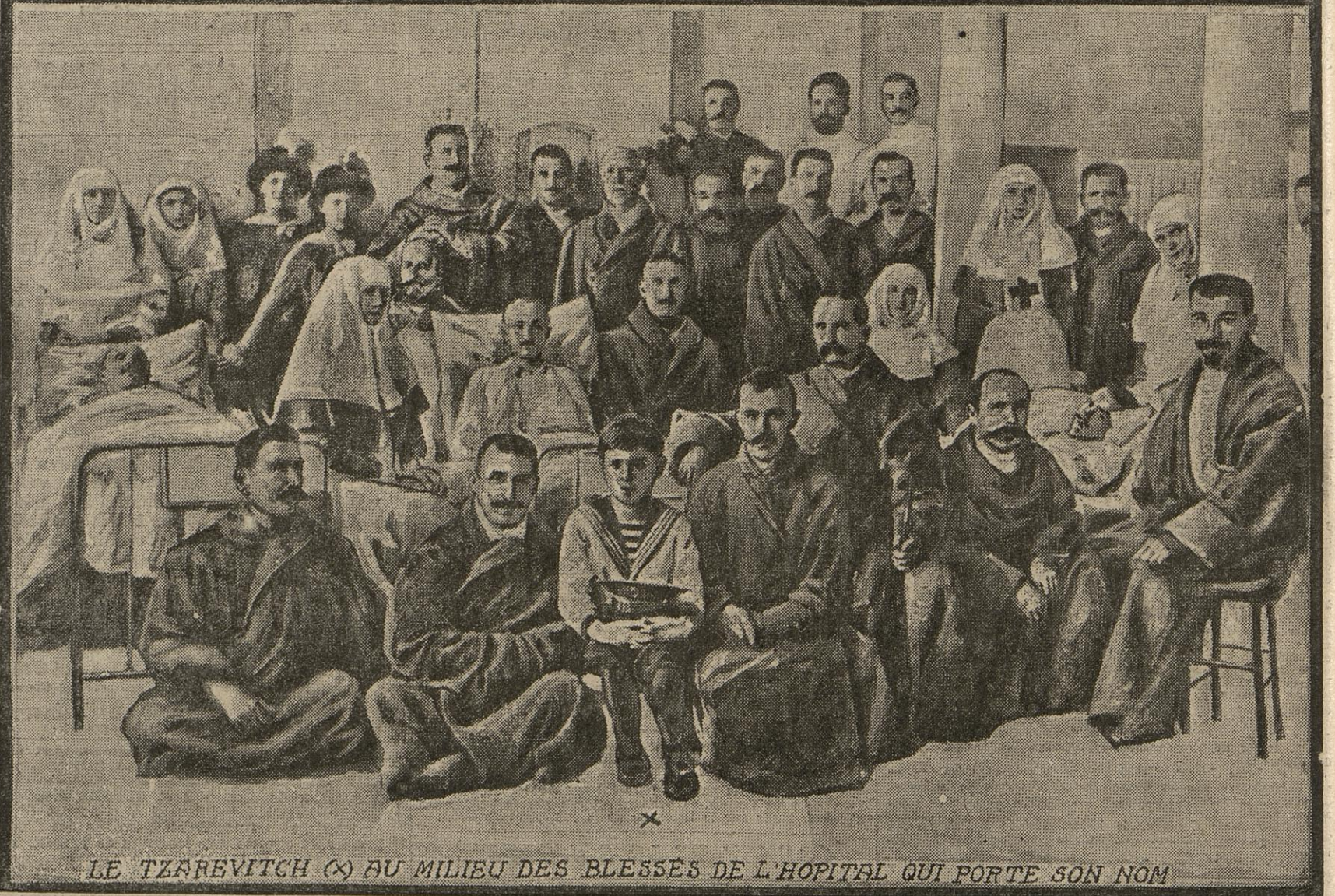
LE TSAREVITCH (*) AU MILIEU DES BLESSÉS DE L'HOPITAL QUI PORTE SON NOM

Les hôpitaux militaires russes reçoivent journellement la visite de hautes personnalités. En effet, l'empereur et l'impératrice viennent souvent apporter leurs félicitations et leurs encouragements aux blessés. Le tsarevitch, qui patronne une vaste ambulance, passe de longues heures au milieu des victimes de la guerre, et le célèbre tragédien lyrique Chaliapine ne manque jamais de venir distraire ses vaillants compatriotes convalescents.