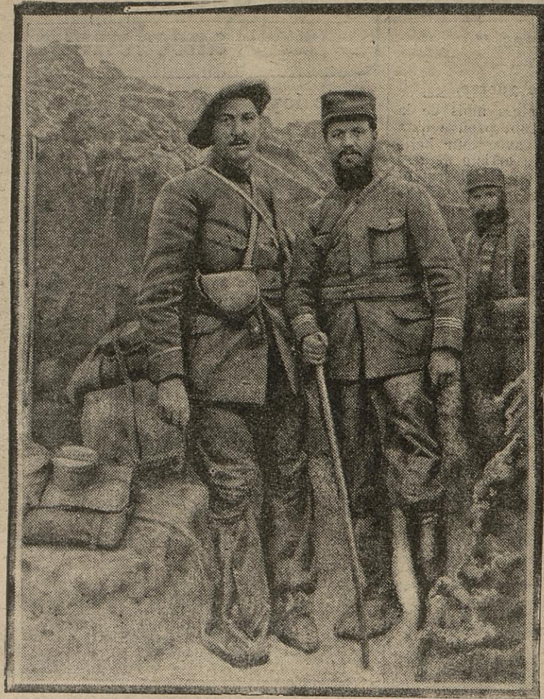
Les pluies persistantes de ces temps derniers ont complètement détrempé la plupart des tranchées. Aussi beaucoup d'officiers ont eu l'idée de recouvrir leurs bottes d'un morceau de toile cirée.