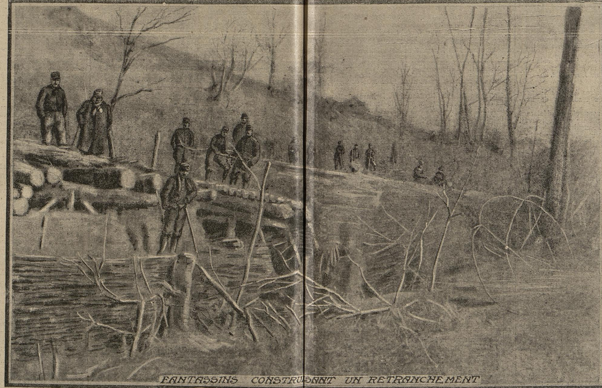
FANTASSINS CONSTRUISSENT UN RETRANCHEMENT