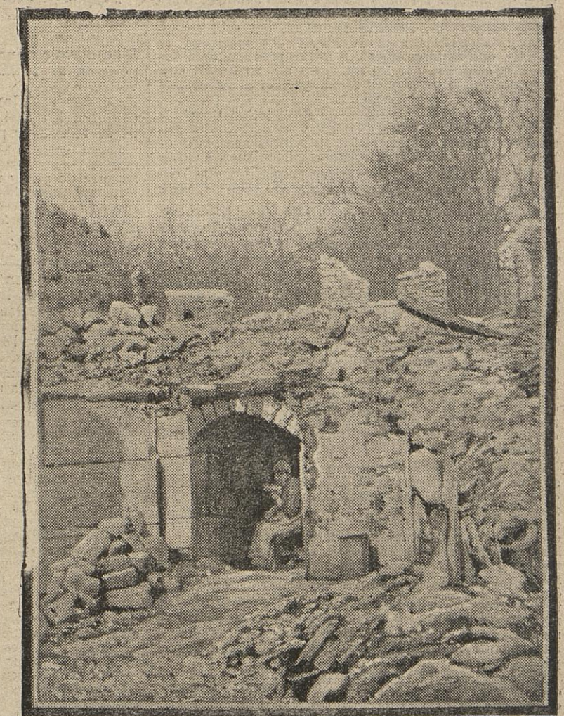
Dans les Hauts de Meuse, le village de Rambercourt fut entièrement incendié par les Allemands. Les habitants durent s'enfuir rapidement; seule, une pauvre vieille resta fidèle à sa petite maison, où elle vit misérablement.