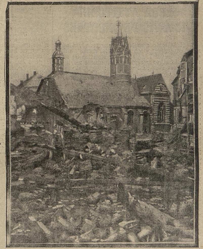
Nous montrions récemment l'œuvre des Barbares à Clermont-en-Argonne. Dans la même région, les soldats du kaiser pillèrent et incendièrent Vienne-le-Château. De ce village il ne reste plus aujourd'hui qu'un amas de décombres.