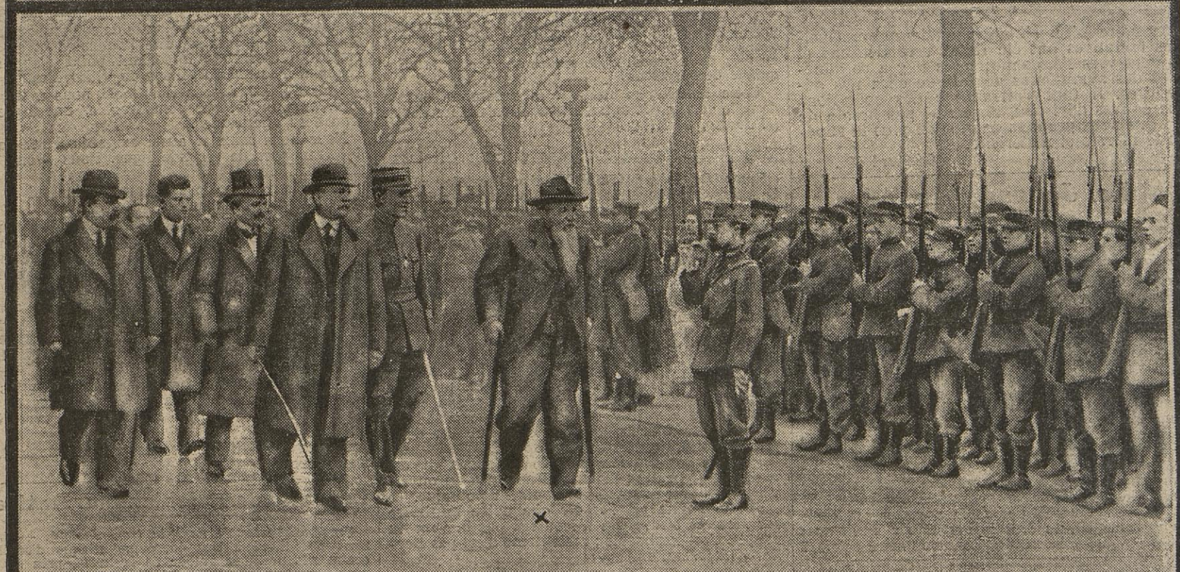
LE G ral GARIBALDI (*)