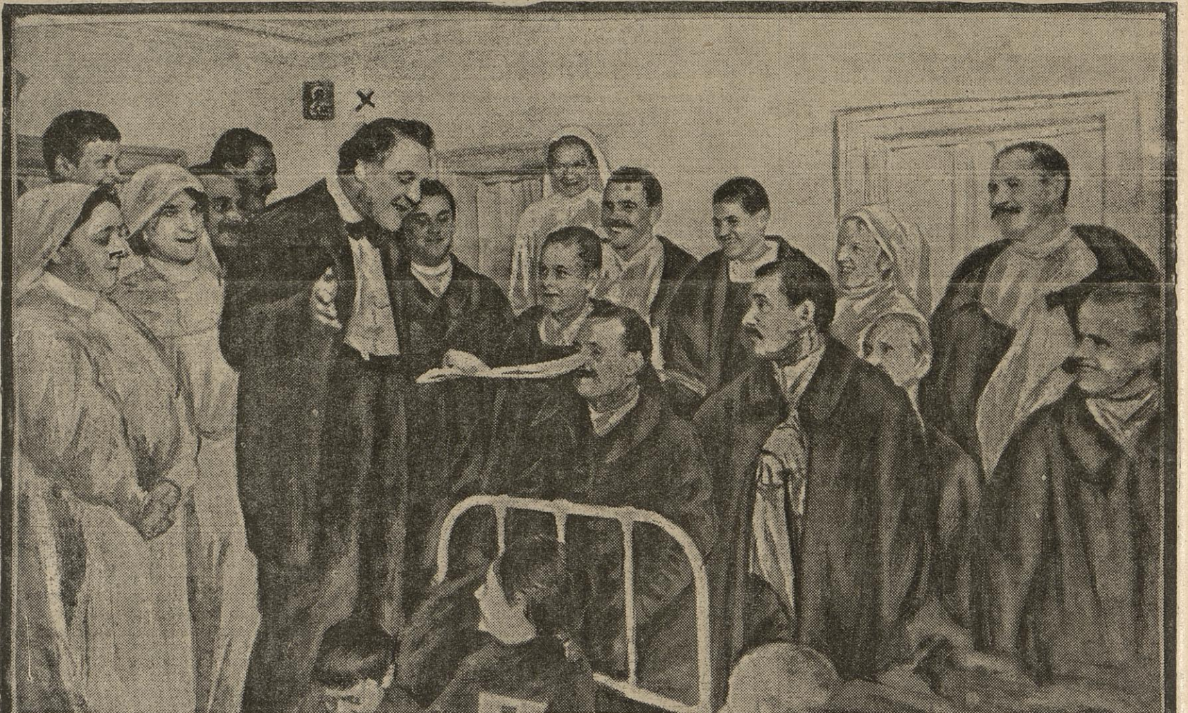
L'ILLUSTRE TRAGÉDIEN LYRIQUE CHALIAPINE (*) CHANTANT DANS UNE AMBULANCE