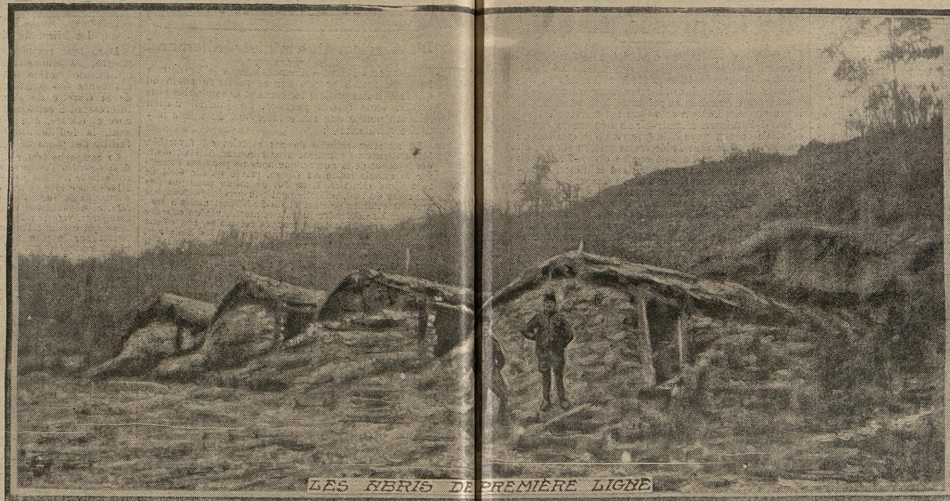
LES HEBERIS DE PREMIERE LIGNE