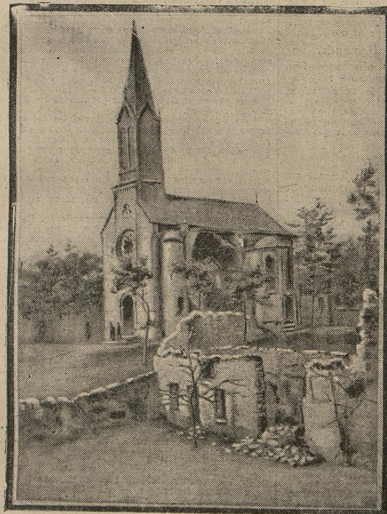
Autour de Reims, bien peu de villages ont été épargnés par l'artillerie ennemie. A Thill, par exemple, la plupart des maisons furent détruites. La petite église ne fut pas ménagée, et un obus allemand est venu l'éventrer.