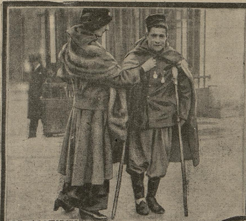
LE GLORIEUX BLESSE MEDAILLE MILITAIRE