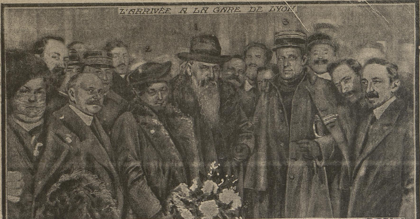
L'ARRIVÉE A LA GARE DE LYON