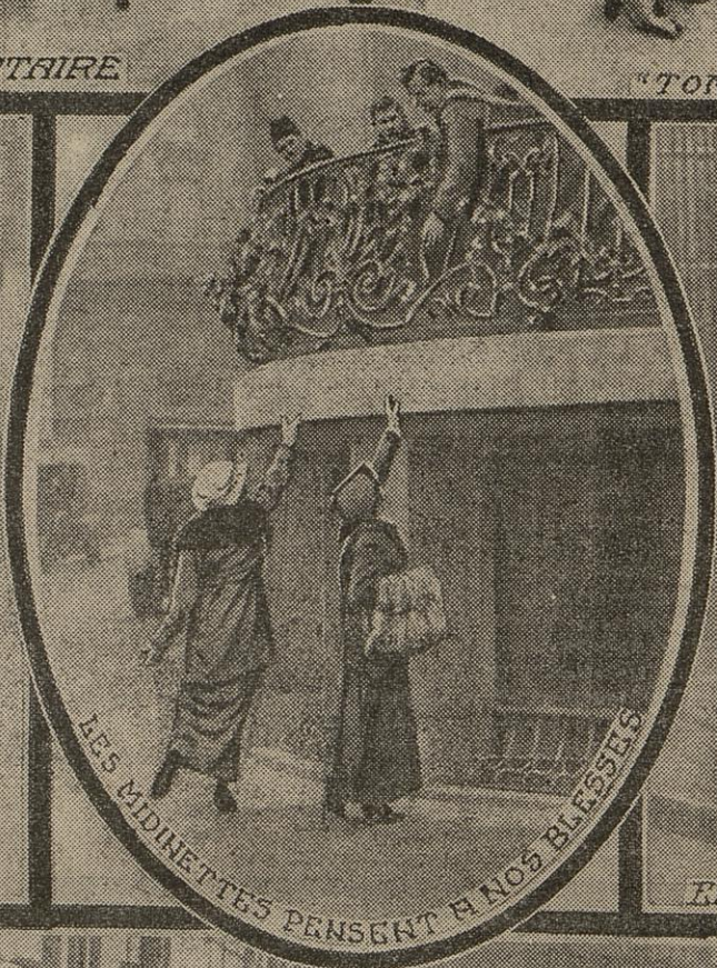
LES MADINETTES PENSENT A NOS BLESSES