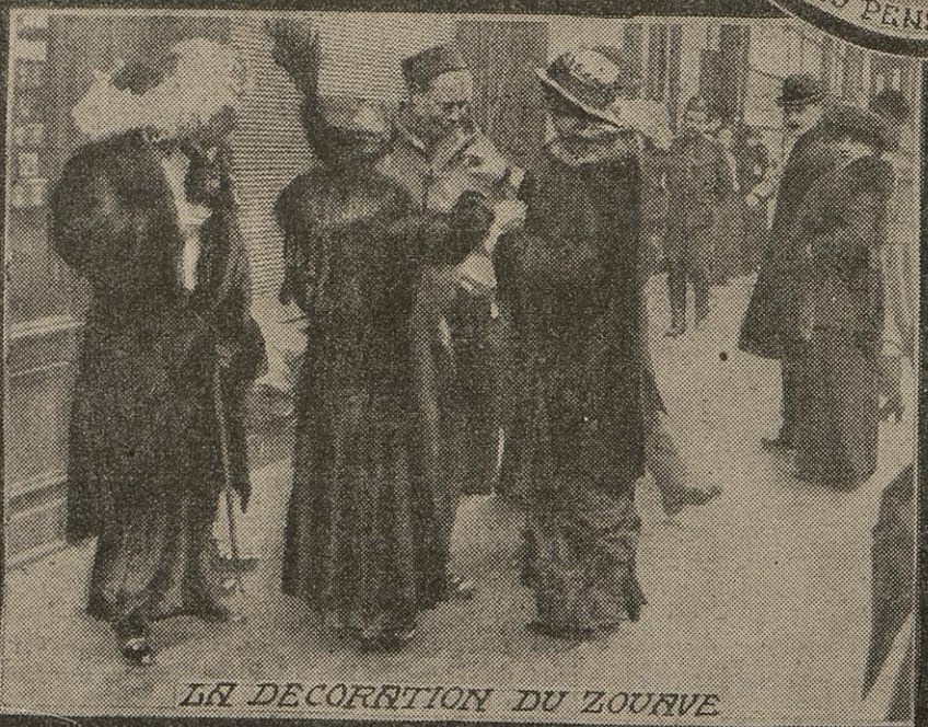
LA DECORRTION DU ZOUAVE