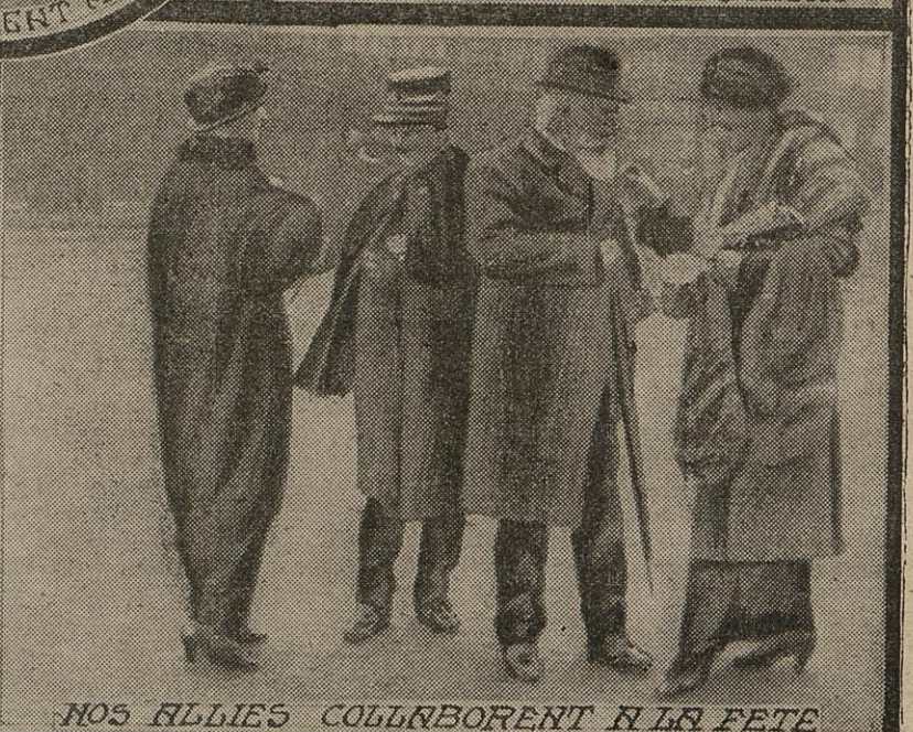
NOS FILLES COLLABORENT A LA FETE

Le dimanche 7 février demeurera, dans les annales françaises, « la Journée du 75 ». On sait, en effet, que sur l'initiative du Touring-Club de France et sous le haut patronage du président de la République, une œuvre s'est fondée dont le but est de fournir à nos soldats au front des millions d'objets utiles destinés à assurer leur santé, à maintenir leur bien-être et leur légendaire bonne humeur. C'est pourquoi hier, sur tout le territoire de la France, ont été offerts au public des insignes commémoratifs que chacun était heureux d'arborer à son corsage ou à sa boutonnière.