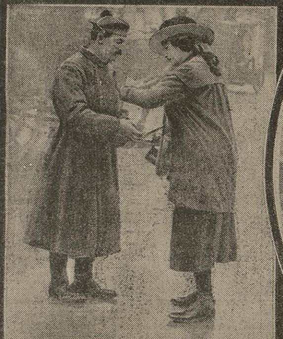
L'OBOLE DU MARIN