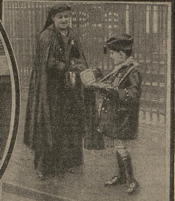
EN ATTENDANT D'ETRE SOLDAT