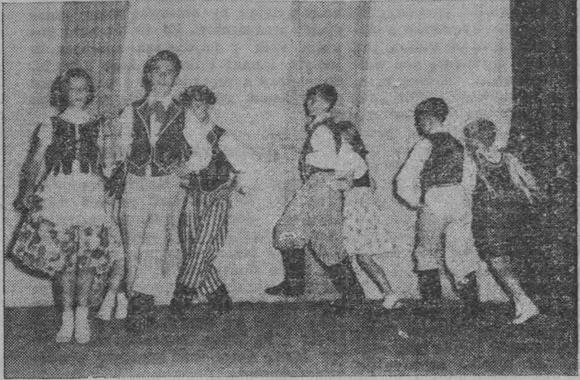
Mazur w wykonaniu grupy młodzieży starszej ze szkoły w Lancaster.

W słoneczną niedzielę czerwca „polskie Preston”, przeżyło swą wielką i pionierską uroczystość. Od wczesnego południa do wieczora odbywał się tam zlot młodzieży szkół ojczyznych (sobotnich) okręgu szkolnego SPK—Lancaster. W okręgu tym, istnieje 6 szkół SPK (w tym jedna wspólna z Komitetem Parafialnym) oraz jeden punkt nauczania (w Penrith).