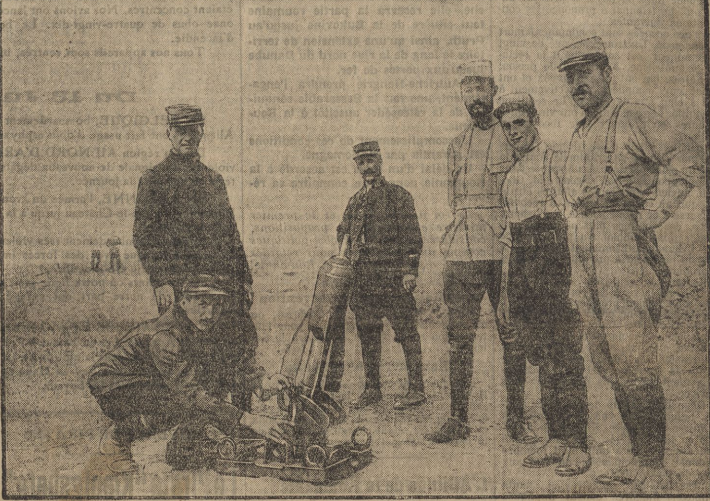
EXPERIENCE DE « MINNEWERFER »