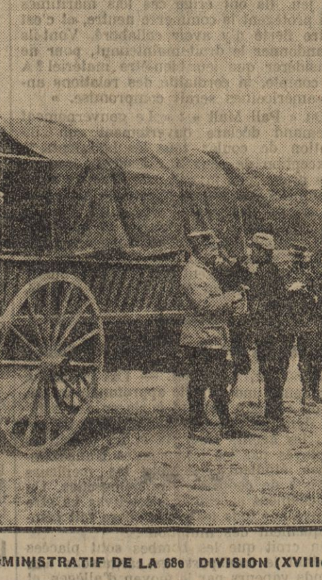
LE CONVOI ADMINISTRATIF DE LA 68e DIVISION (XVIIIe CORPS)