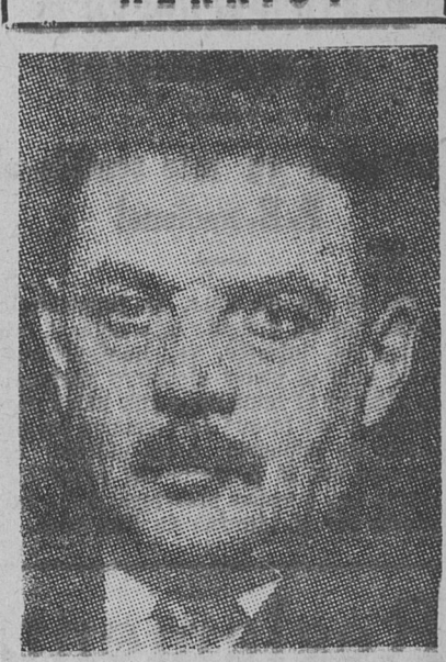
QUE PRESENTO SU RENUNCIA y con él los ministros de la fracción radical socialista.

PARIS, 6. — El parlamento suspendió su sesión en señal de duelo por las muertes de Poincaré, Barthou y el rey Alejandro, después de 25 minutos de sesión, durante los cuales las izquierdas hicieron diversas manifestaciones de protesta.