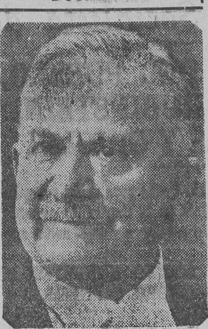
JEFE DEL GABINETE FRANCÉS, que se verá obligado a dimitir en la sesión de mañana.

tendido a otros centros sindicalistas como ser Barcelona y Andalucía.