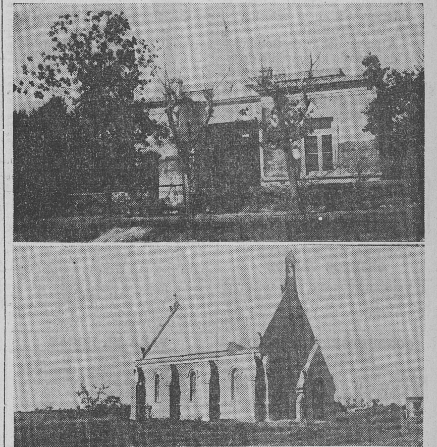
MIENTRAS LA HUMILDE ESCUELA DE DE BARY APARECE vieja y derruida, hablando de la desidia oficial con la elocuencia de sus ladrillos desmoronados, la iglesia surge lujosa y acicalada en medio de un campo por el que pululan hombres hambrientos