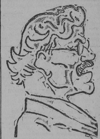
DENUNCIO LA POLITICA EXTERIOR DE JAPON

Marían a menos de dos millas de distancia de Pekín.