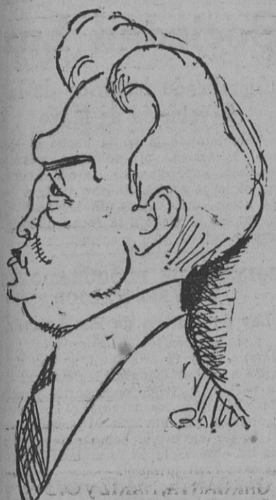
PRONUNCIO UNA IMPORTANTE conferencia en Ginebra

consulta demostraba que una nación era culpable de agresión, Estados Unidos se abstendría de toda actitud tendiente a impedir el esfuerzo colectivo que las naciones pudiesen tomar para restablecer la paz.