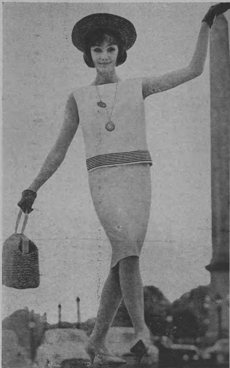
Komplecik letni z naturalnego szantungu w kolorze białym z brązowymi akcesoriami. Spódniczka prosta.

ORŁA BIAŁEGO—SYRENY z dnia 21 lipca 1960.