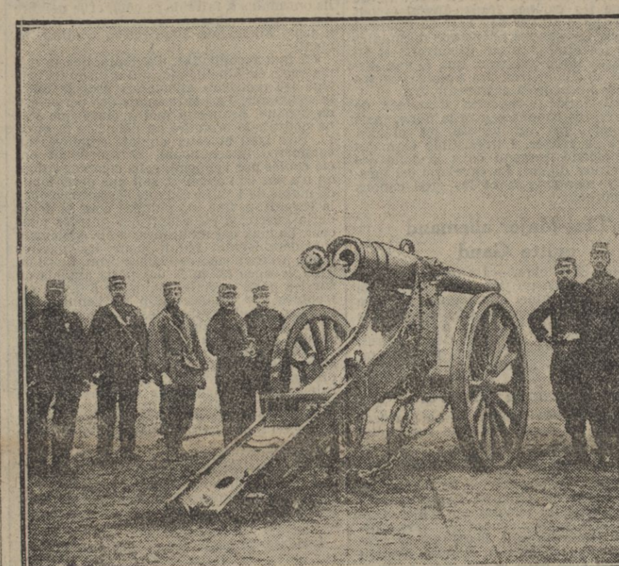
Mancuvre d'une pièce de siège (150 mm) sur le terrain Jean-Jacques Boas, à Bordeaux.