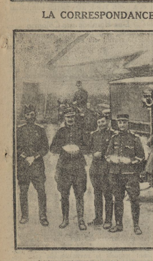
Voiture automobile postale parietonne transportant sur le front les lettres adressées aux combattants