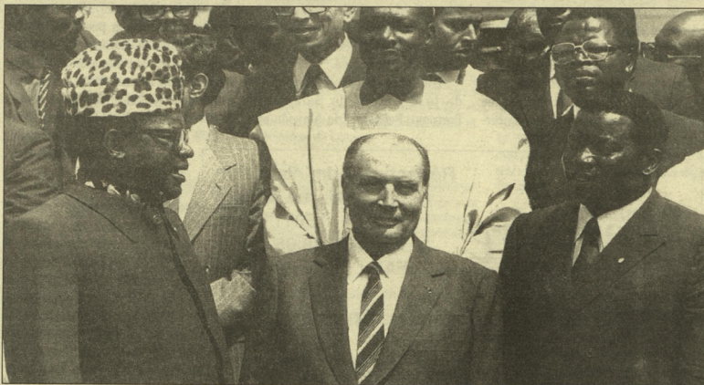
13 e sommet franco-africain à Lomé (Togo) en 1986 : François Mitterrand est entouré des présidents zairois Mobutu (à gauche) et togolais Eyadema, deux « démocrates » amis de la France.

LA CORRUPTION POLITICO-FINANCIÈRE EN FRANCE