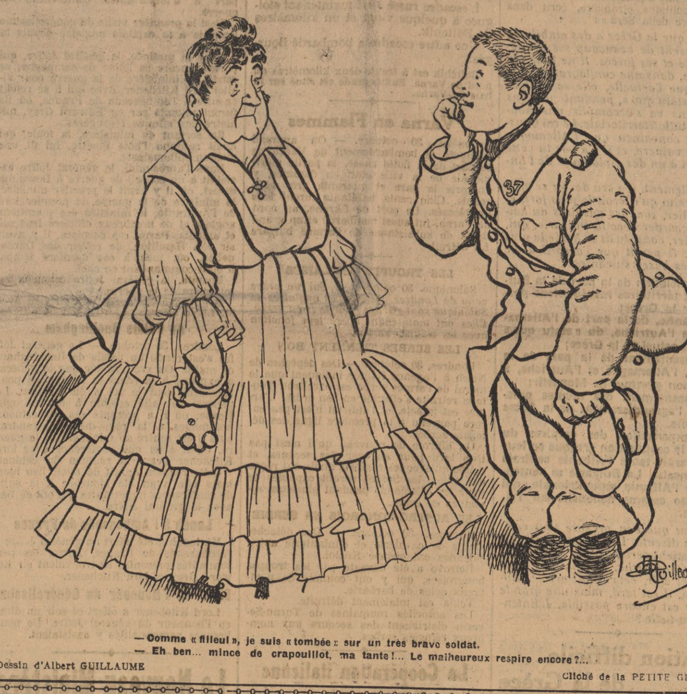
— Comme ça filait, je suis tombé : sur un très brave soldat. — Eh ben... mince de crapoulait, ma tante !. Le malheureux respire encore ?.