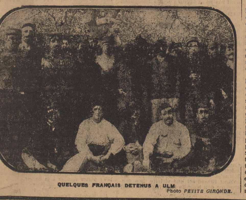
QUELQUES FRANÇAIS DETENUS A ULM