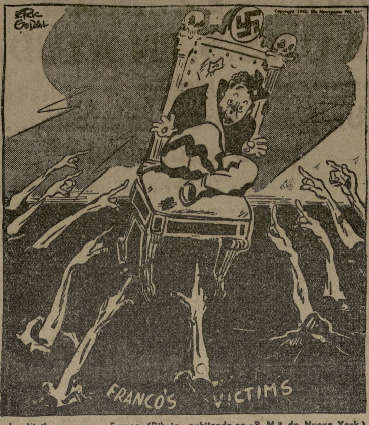
Las víctimas acusan a Franco. (Dibujo publicado en "P.M." de Nueva York.)

La ya iniciada serie de huelgas, protestas y manifestaciones de masas y luchas guerrilleras.