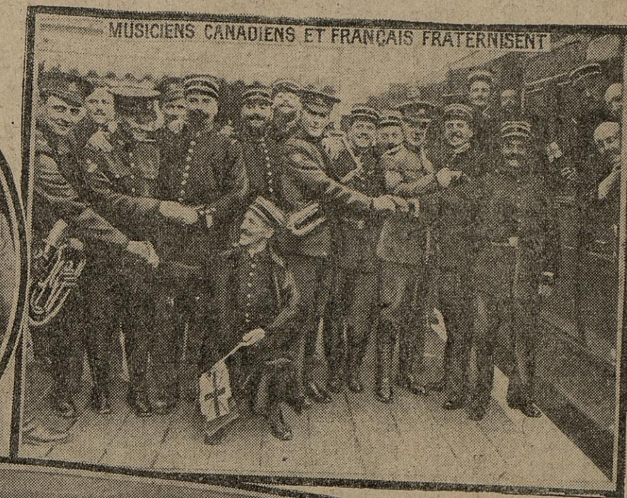
MUSICIENS CANADIENS ET FRANÇAIS FRATERNISENT