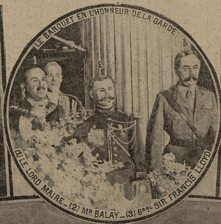
LE BANQUET EN L'HONNEUR DE LA GARDE (1) LE LORD MAIRE - (2) MR BALAY - (3) GÉNÉRAL SIR FRANCIS LLOYD