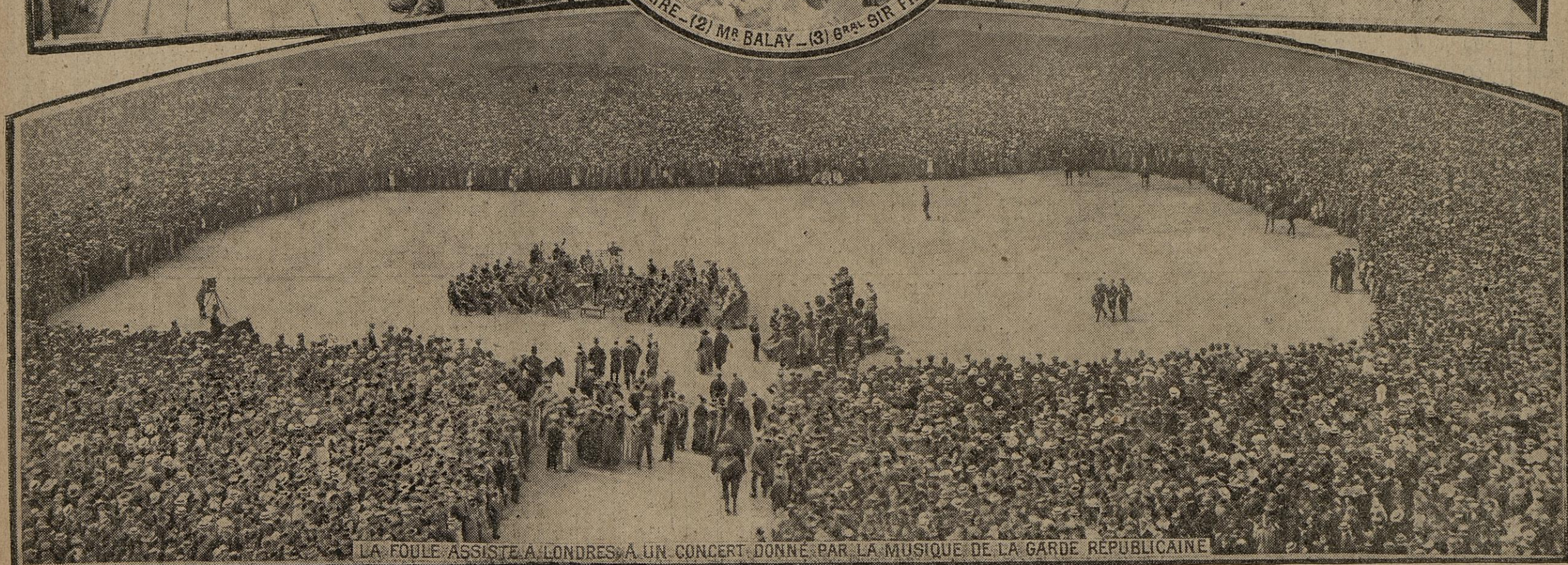
LA FOULE ASSISTE A LONDRES A UN CONCERT DONNE PAR LA MUSIQUE DE LA GARDE REPUBLICAINE

La musique de notre garde républicaine reçoit en ce moment, dans le Royaume-Uni, un accueil enthousiaste. Avant de quitter Londres, et pour remercier la population des marques de sympathie si vives qu'elle en avait reçues, la garde, à l'issue de la parade des Horse Guards, a donné l'autre matin un concert en plein air auquel a assisté un auditoire que l'on peut chiffrer à 100.000 personnes.