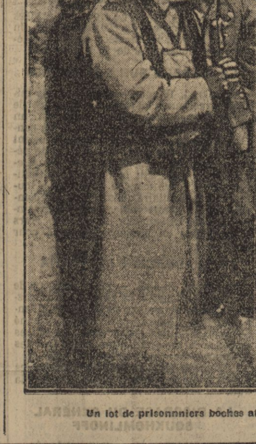
Un lot de prisonniers boches attendant leur transfert à l'arrière.