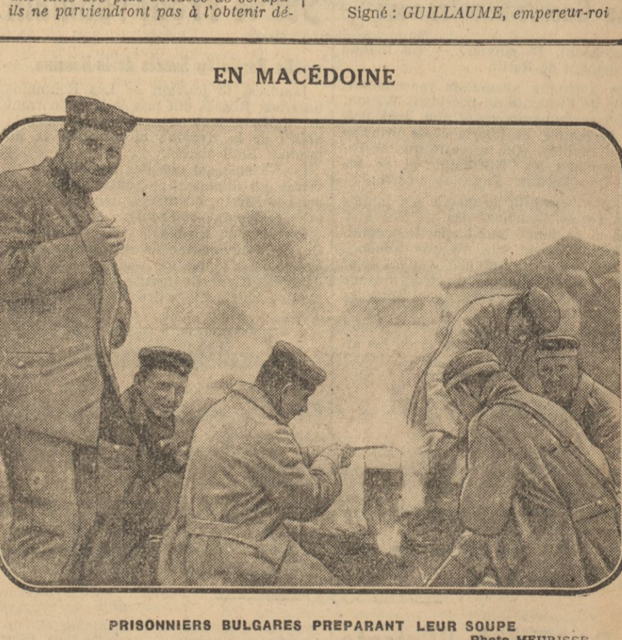
PRISONNIERS BULGARES PREPARANT LEUR SOUPE

pour crier au cocher d'avancer, car il s'était précipité d'un trot, au bruit de détonation, et je vis des passés en courant vers la voiture. Je le regardai. — Il me répondit, courant toujours: — Je ne sais pas! On ne sait rien! Un vent de panique soufflait sur le boulevard. Une foule débouchant de la rue Le-Pelletier, où était alors situé l'Opéra, en poussant des cris de terreur.