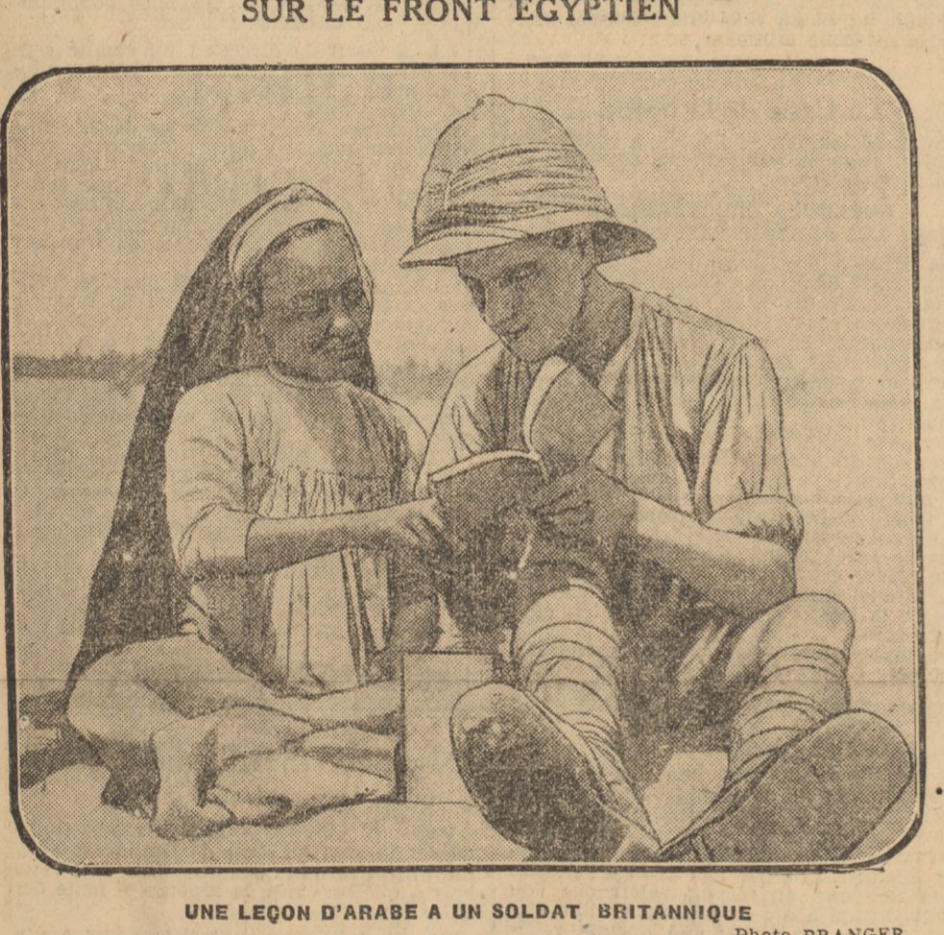
UN LEÇON D'ARABE A UN SOLDAT BRITANNIQUE