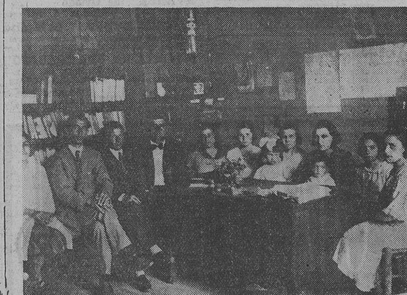
COMPAÑERAS Y COMPAÑEROS QUE INTEGRAN LA COMISIÓN DE LA BIBLIOTECA POPULAR "Juan B. Justo", de Tres Lomas, provincia de Buenos Aires.