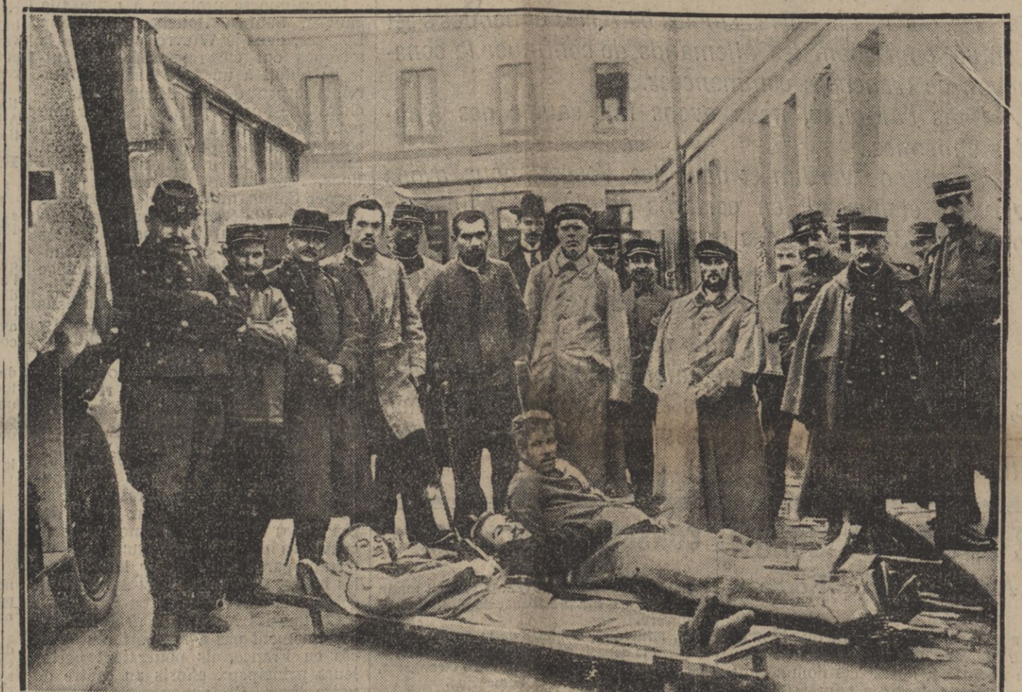
BLESSÉS ALLEMANDS CONDUITS AU SERVICE CENTRAL DE RADIOGRAPHIE