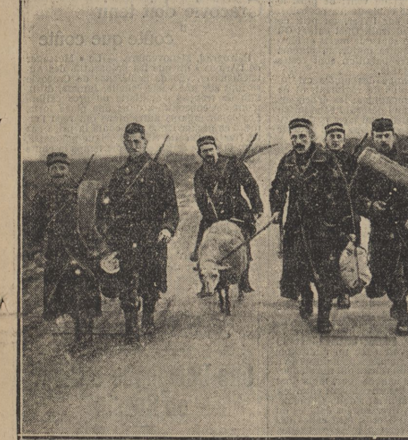
SOLDATS BELGES AVEC LEUR MOUTON « MASOTTE »

malheureux départements envahis a touché tous les cœurs. Les envois de secours en argent et en nature prennent le caractère de véritables manifestations fraternelles et humanitaires.