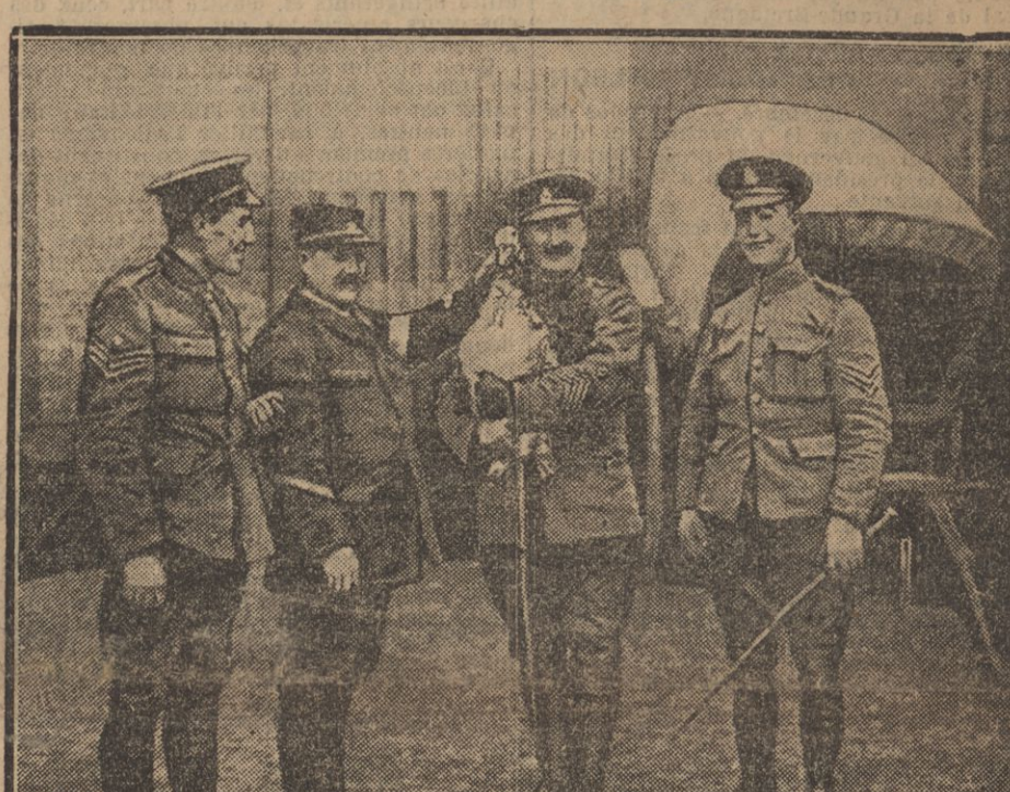
UN OFFICIER ANGLAIS VIENT DE RECEVOIR L'OFFICIER DE NOËL.