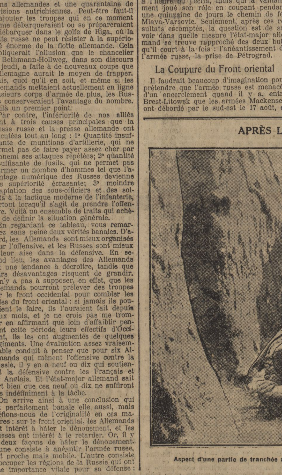
Aspect d'une partie de tranchée allemande en Artois après une attaque.