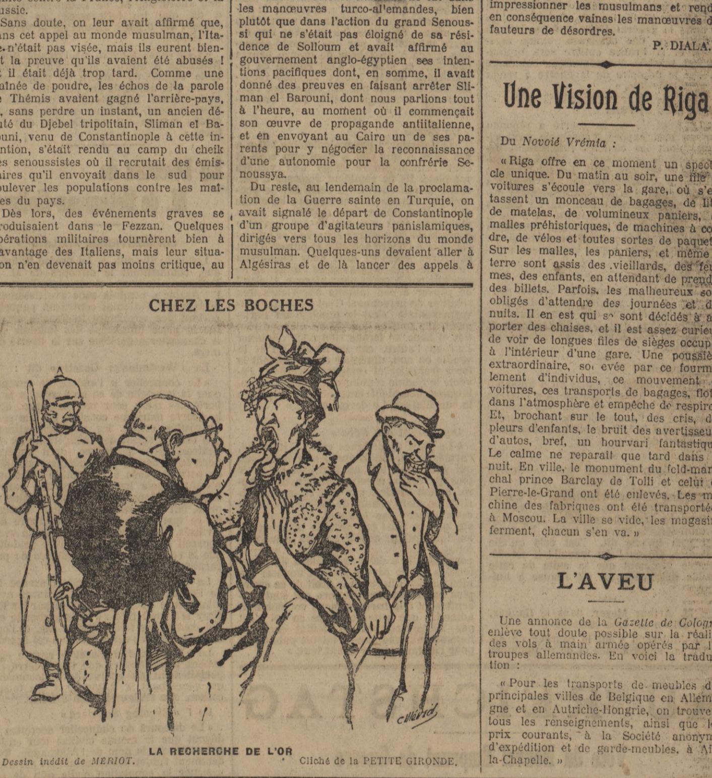
LA RECHERCHE DE L'OR. Dessin inédit de MERIOT.

FEUILLETON DE LA PETITE GIRONDE DU 22 AOUT 1915