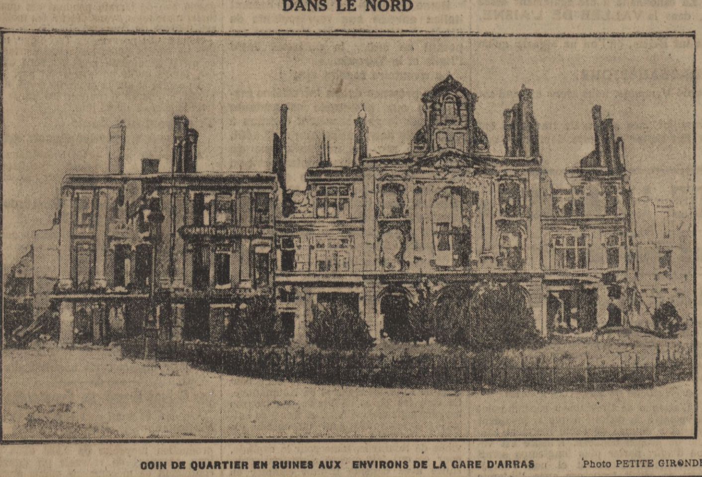
COIN DE QUARTIER EN RUINES AUX ENVIRONS DE LA GARE D'ARRAS.