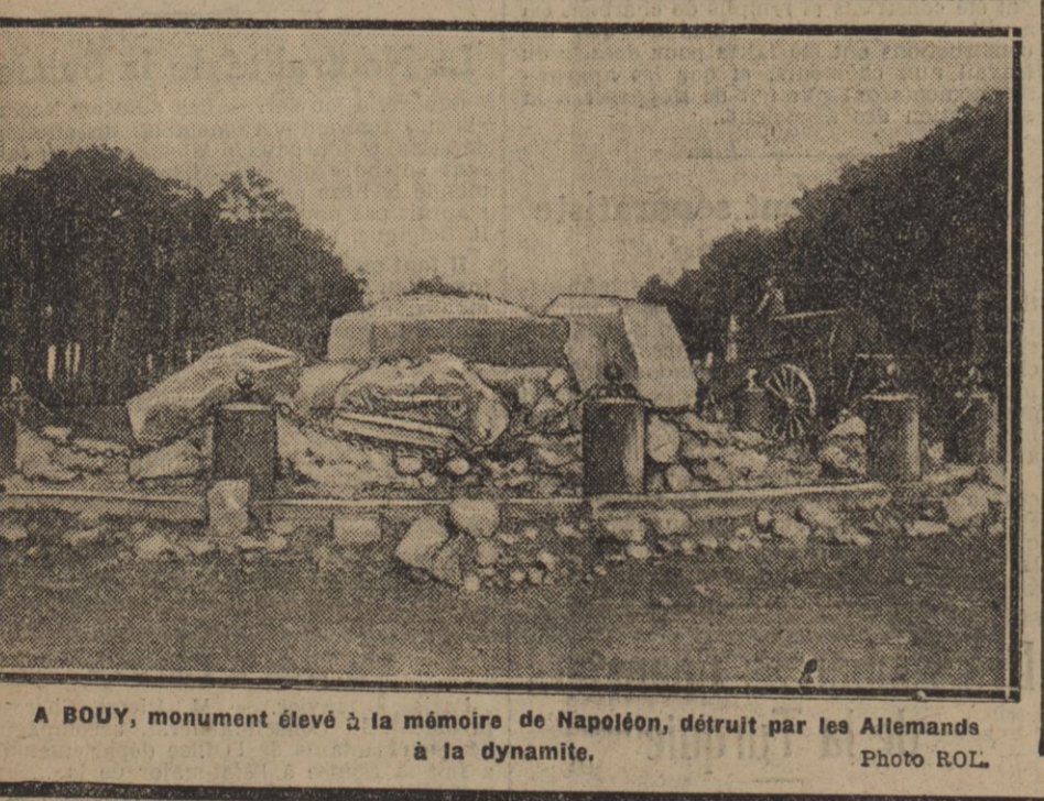
A BOUY, monument élevé à la mémoire de Napoléon, détruit par les Allemands à la dynamite.