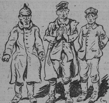
Malheureux, la guerre !