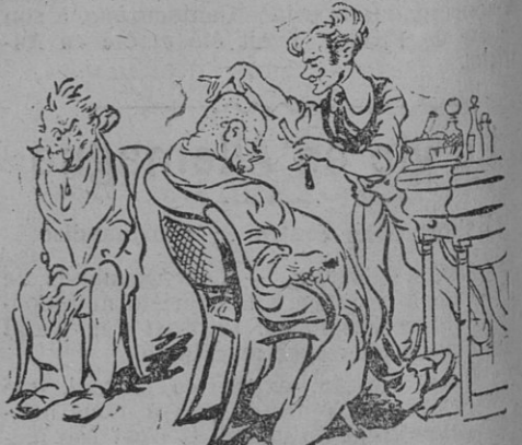
Chez le coiffeur

les catholiques, qui attendaient à la porte, patiemment, pouvaient à leur tour venir supplier Celui qui ne les a pas abandonnés de continuer son œuvre de justice et de confondre à tout jamais le peuple des voleurs et des assassins. Rangés de chaque côté de la porte, ils regardaient, impassibles, défilier le général, dont le casque sans couverture flamboyait au soleil, les officiers arrogants, le monoclé à l'œil, et cette toute servile de soldats, si heureux d'exécuter les plus infâmes commandements, et dont la mentalité n'a pas changé depuis 122 ans.