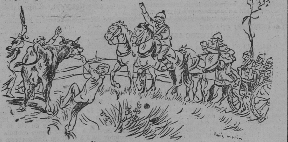
Nous ramenâmes l'une d'elles...

Ainsi l'église de Chauny fut réclamée par les pasteurs, dont la troupe suivait