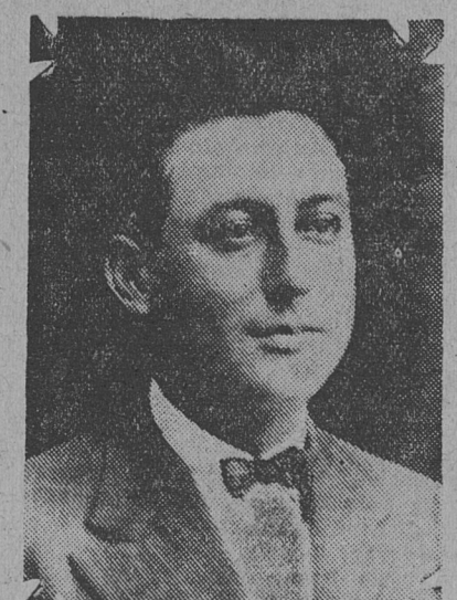
del Tribunal de Cuentas, IRINEO COSCIA.