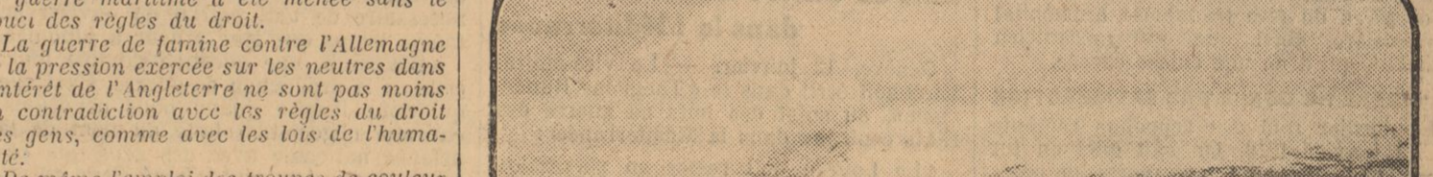
UNE COLONNE DE SKIERS EN MARCHÉ.

Le Martyre d'un Policier. Par JULES DE GASTYNE. Deuxième partie. Maîtresse d'Empereur. Au bruit de nos pas, la porte du vestibule s'ouvrit. Une forme blanche se montra sur le seuil, et une voix demanda : — C'est vous ?