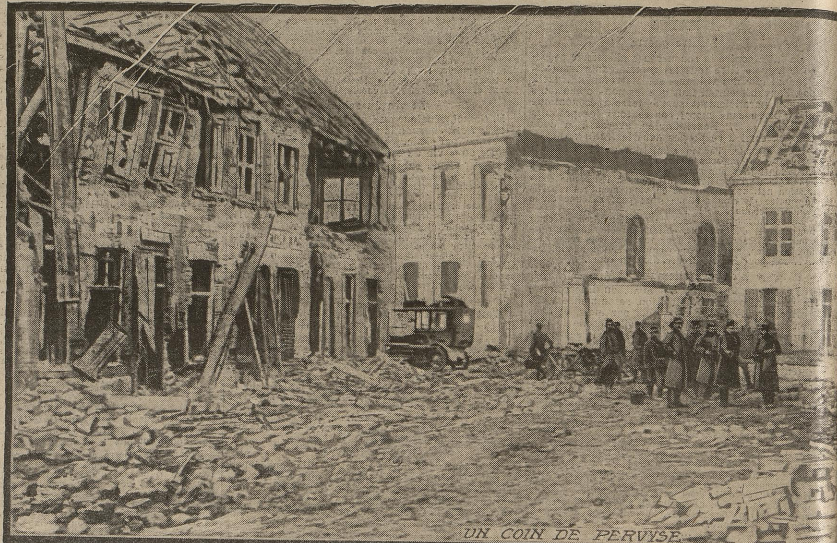
UN COIN DE PERVYSE.