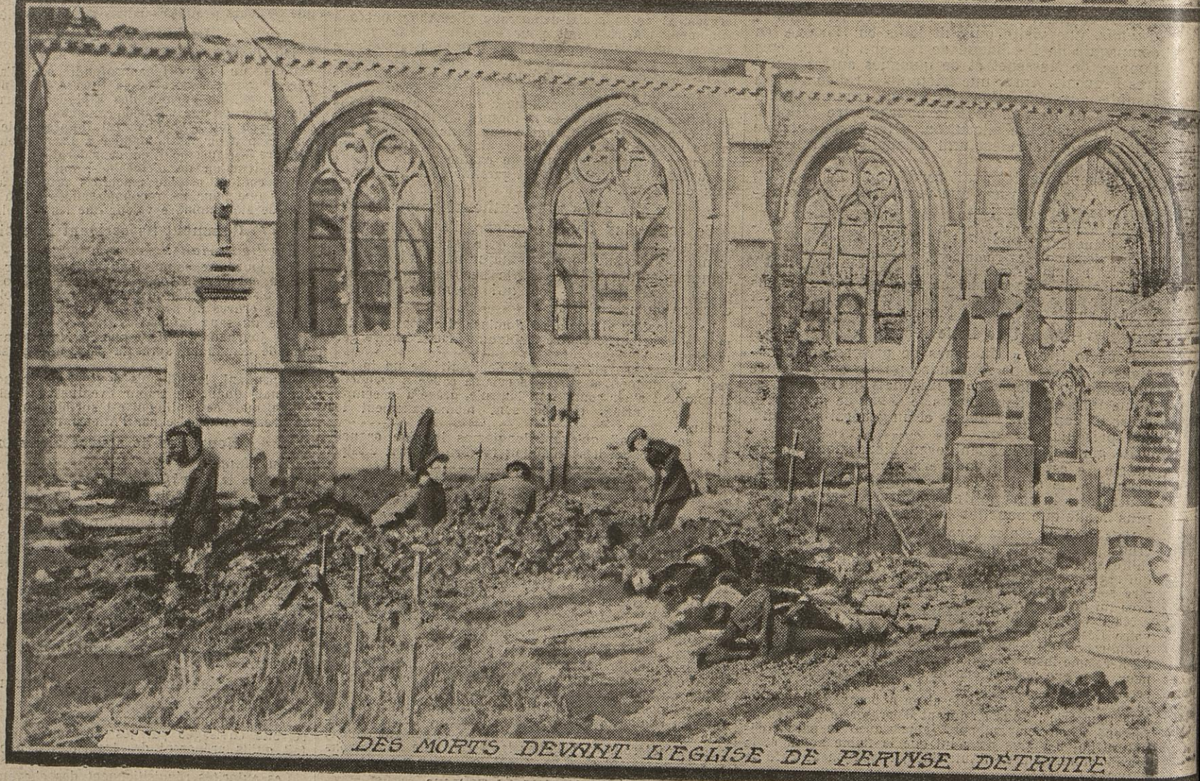
DES MORTS DEVANT L'ÉGLISE DE PERVYSE DÉTRUITE