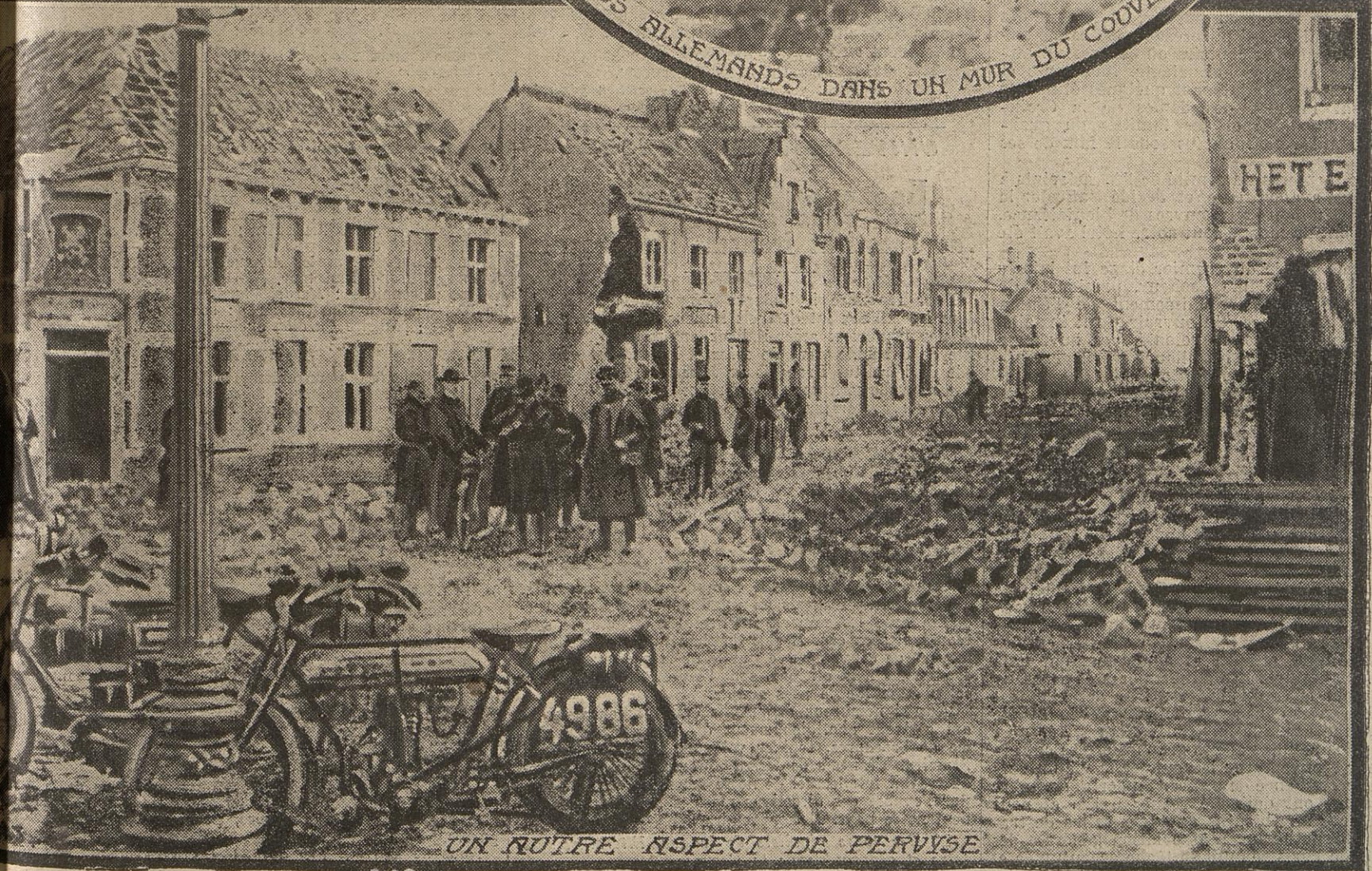
UN AUTRE ASPECT DE PERVYSE

Pervyse et Nieuport conserveront longtemps les traces du passage des Allemands. Certains quartiers de Pervyse ne sont plus, en fait, qu'un amas de ruines. L'église est à terre, comme un corps effondré et écrasé. Le cimetière était devant l'église. Plus de pierres tombales, plus de fleurs, plus rien que quelques croix ébréchées. Nieuport fut aussi bombardé, et dans la ville on ne trouve partout que vestiges de la bataille.