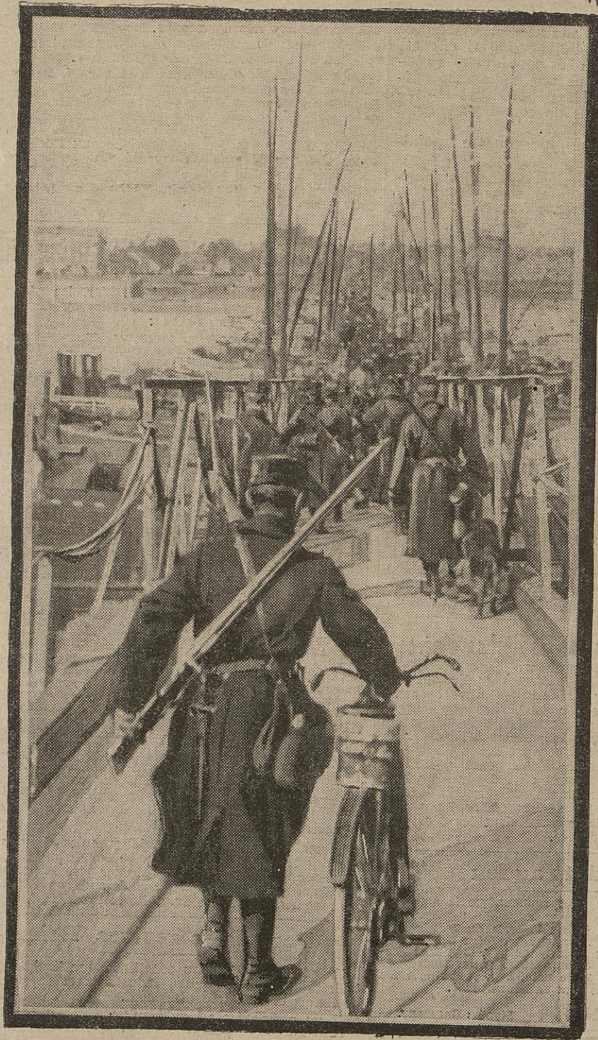
Avant la reddition d'Anvers, la garnison de la ville effectua sa retraite en bon ordre. Elle passa sur un pont de bateaux pour aller se joindre à l'armée de campagne, et combattit encore pour arrêter les attaques de l'ennemi.