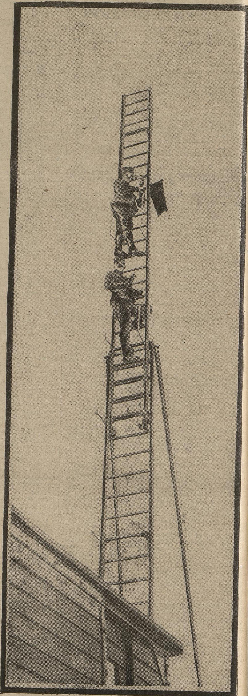
Nous donnions hier la photographie d'un des trains blindés utilisés par l'armée belge. Sur chacun de ces convois armés se dresse une grande échelle qui sert de poste d'observation aux officiers chargés de constater les effets du tir.

Un tobre la ru Allen ans, en fa vais violen pos WU troisi violen mois Pill corre délits habit niers 40 an Calai Julie d'em Senli