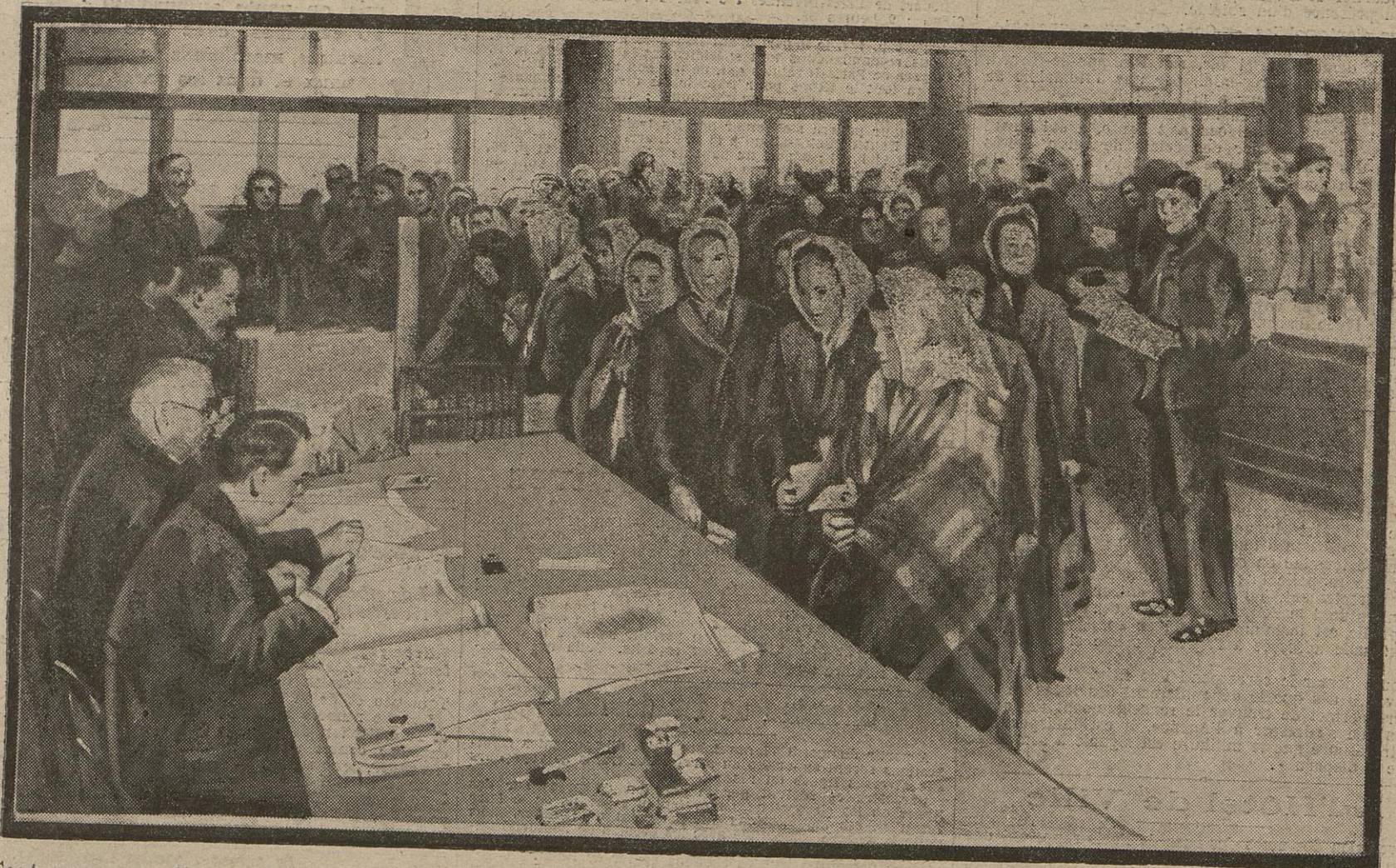
Tout comme en France, les femmes des réservistes et territoriaux mobilisés touchent en Russie certaines indemnités qui varient suivant le nombre des enfants à nourrir. A Pétersbourg, ce sont, toutes les semaines, dans les bureaux spéciaux, de longs défilés de ces épouses nécessiteuses.