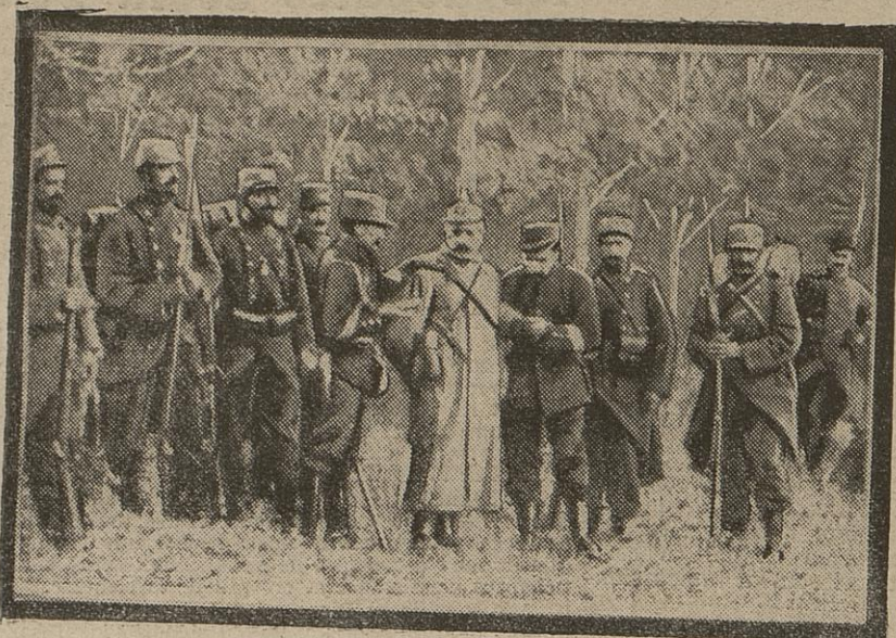
Capturé au moment où il s'aventurait trop près de nos lignes, un officier allemand est fait prisonnier et subit un premier interrogatoire avant d'être envoyé en captivité.