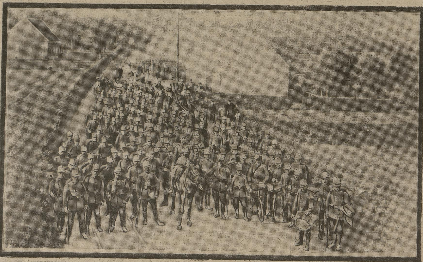
Après la prise d'Anvers, les Allemands avaient fait occuper la ville par des troupes appartenant à la réserve et à la territoriale. L'invasion russe devenant menaçante, une grande partie de ces effectifs viennent d'être dirigés sur la Prusse orientale, pour faire face aux attaques de nos alliés.