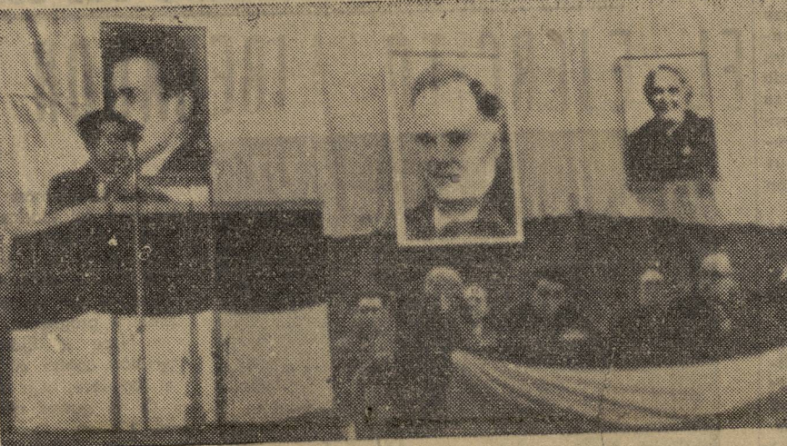
La producción de la Unión Soviética...

Basta de división! (Aplausos.) Desde el interior de España llega el clamor pidiendo la unidad de las fuerzas republicanas. Desde las cárceles y desde las fábricas, desde los pueblos y aldeas, desde lo más profundo del país, llega la voz unánime que clama por la unidad antifranquista. A ese clamor, nuestro Partido contesta: Unidad, Unidad y Unidad. (Gran ovación.)