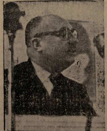
El camarada JACQUES DUCLOS

Asegurar la repatriación en los plazos más cortos posibles, destinando para ello cuantos recursos y medios sean precisos, de todos los españoles que se encuentran en forzada emigración y que expresen su deseo de regresar a la Patria. (Del programa de reivindicaciones inmediatas expuesto por la camarada DOLORES IBARRURI en el Pleno de Toulouse)