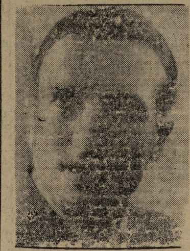
El camarada CRISTINO GARCIA

He aquí un nuevo hecho brutal demostrativo de las siniestras intenciones franquistas de ahogar en sangre la lucha del pueblo español, de llevar a cabo una guerra de exterminio contra los patriotas.