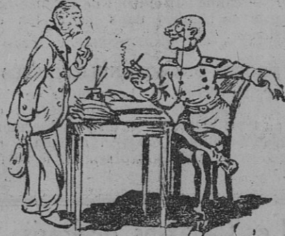
Je vais trouver l'officier de service.