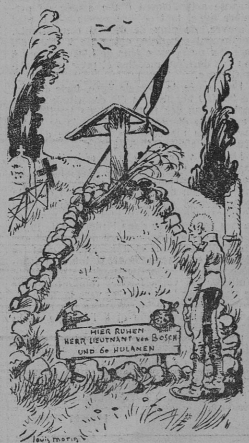
Les tombes des Allemands

C'était encore sur la place du Marché : on avait le droit d'y venir chercher des