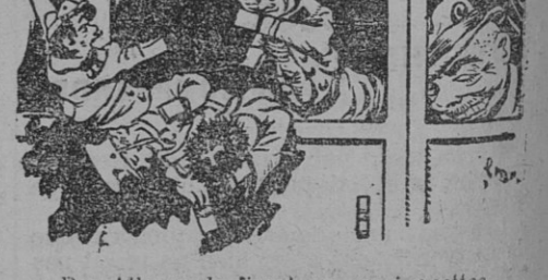
Des Allemands firent ses marionnettes

C'est toujours, même au cimetière, la horde d'esclaves de Rouget de Lisle, la horde anonyme enfouie autour du burgrave, dont le nom seul doit passer à la postérité !