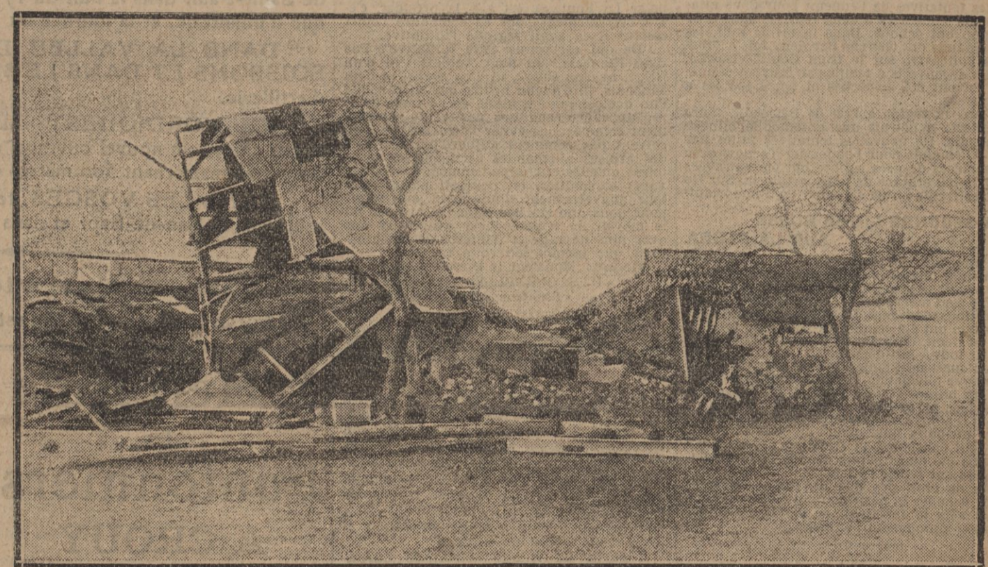
Sur le front