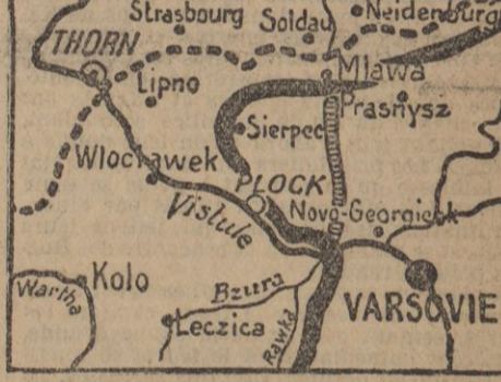
Les derniers communiqués officiels de l'état-major russe ont annoncé la reconquête de Sierp et de Plock par les soldats de leur armée.

Les derniers communiqués officiels de l'état-major russe ont annoncé la reconquête de Sierp et de Plock par les soldats de leur armée. Nos alliés avancent au nord de la Vistule dans la direction de la place forte allemande de Thorn. Leurs progrès sont déjà très sensibles, comme le montre le croquis ci-dessous, où les hachures indiquent le front russe tel qu'il devait être d'après nos informations à la date du 10 janvier, et le gros trait noir le front russe actuel.