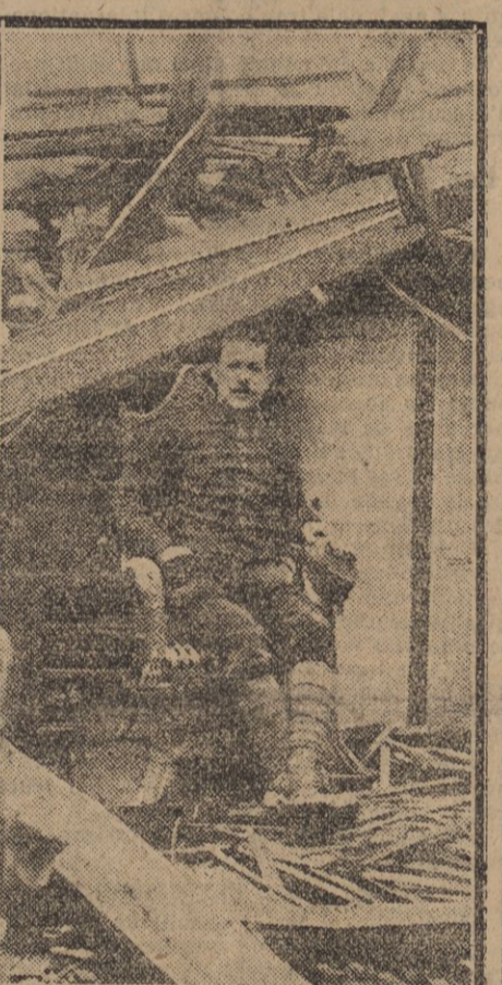
Un de nos soldats au repos dans un salon que vient de traverser une « marmotte » allemande.

avec les gros mortiers autrichiens qui portent à 12 kilomètres, et ils ont tué ou blessé un grand nombre de Français et de Belges qui s'y trouvaient.