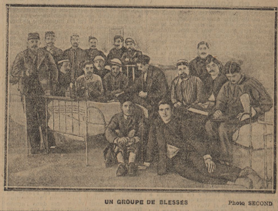
UN GROUPE DE BLESSÉS.