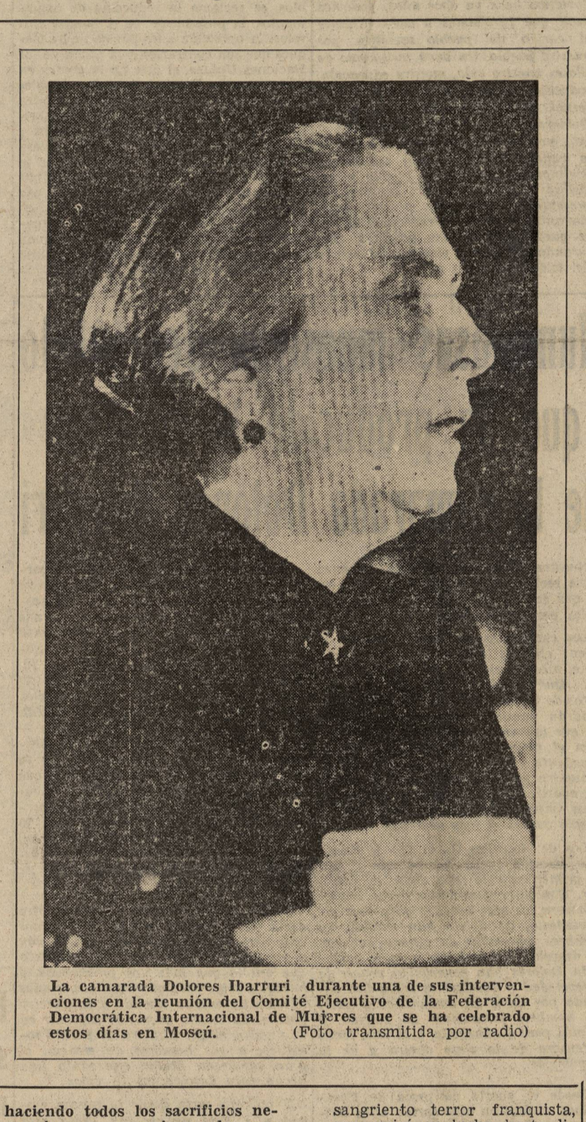
La camarada Dolores Ibarruri durante una de sus intervenciones en la reunión del Comité Ejecutivo de la Federación Democrática Internacional de Mujeres que se ha celebrado estos días en Moscú. (Foto transmitida por radio)