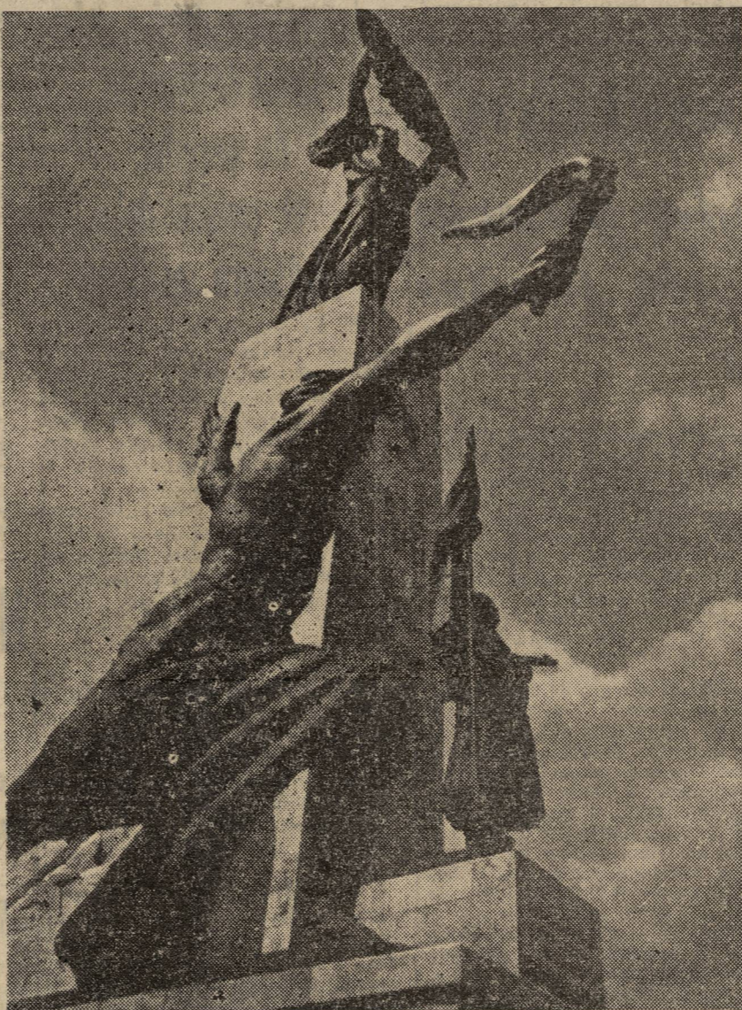
El monumento de la Libertad erigido en el monte Gellért de Budapest en memoria de los héroes del Ejército Soviético que liberaron Hungría.

«La delegación soviética expresa su confianza de que estas proposiciones recibirán el debido apoyo de parte de otras delegaciones. La delegación soviética está convencida de que la adopción de estas proposiciones rendirá un servicio al fortalecimiento de la paz servido en cuyo interés están llamadas a actuar las Naciones Unidas.»