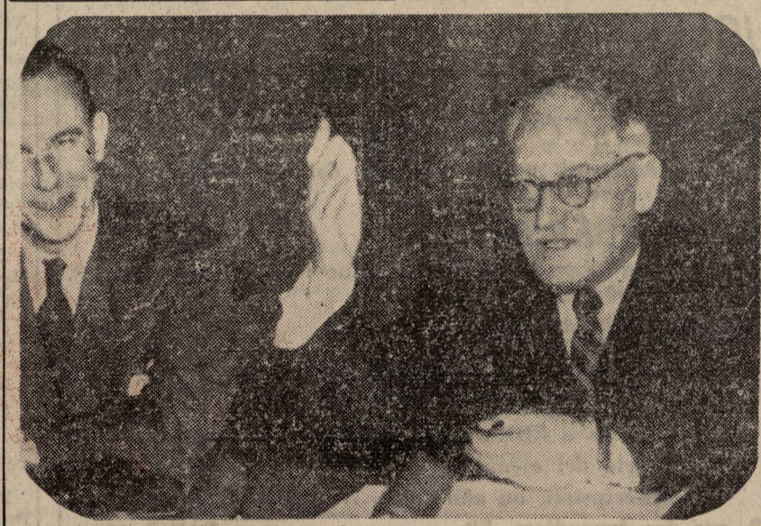
Andrés Y. Vishinski en la Conferencia de Prensa que dió ultimamente en la O.N.U.