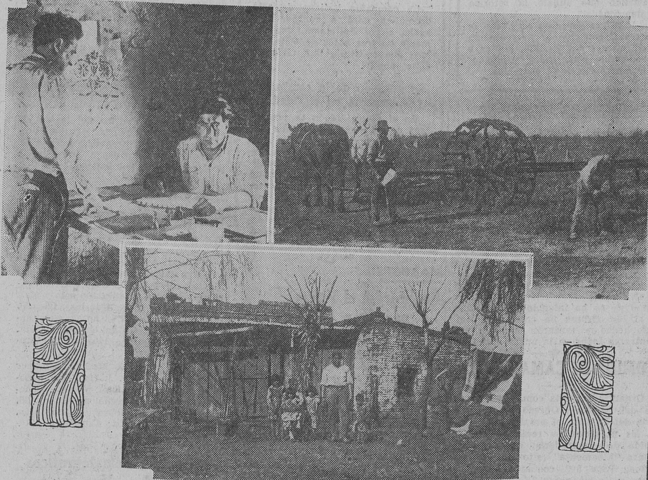
1. SECRETARIA DE LA COOPERATIVA DE LADRILLEROS QUE FUNCIONA EN EL HORNO de Peratta. — 2. Máquina para batir barro. — 3. Vivienda de un trabajador.

bien; todos estos hombres tan diferentes han coincidido en que lo mejor, en las actuales circunstancias, es regirse por normas democráticas y cooperativas. Celebran sus reuniones designando cada vez un presidente; discuten y resuelven sobre compras, ventas, gastos y distribución de las entradas; todos tienen voz y nadie posee más de un voto. Las normas democráticas son tan lógicas y naturales,