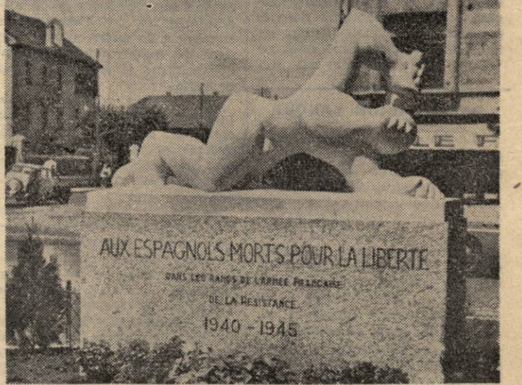
La guerre vient de se terminer. A Annecy, la Résistance française a fait édifier ce monument, dû au ciseau de LOBO, à la mémoire des « Espagnols morts pour la liberté ». Que les temps sont changés !