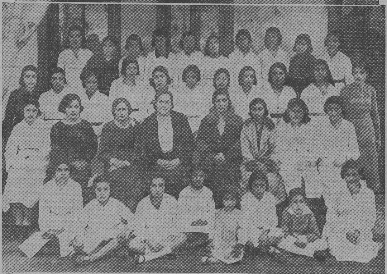
ALUMNAS QUE CONCURREN A LOS CURSOS QUE SE DICTAN EN LA ACADEMIA DE LA Agrupación Femenina "Fenia Chertkoff de Repetto", de estación Mercedes (San Luis).