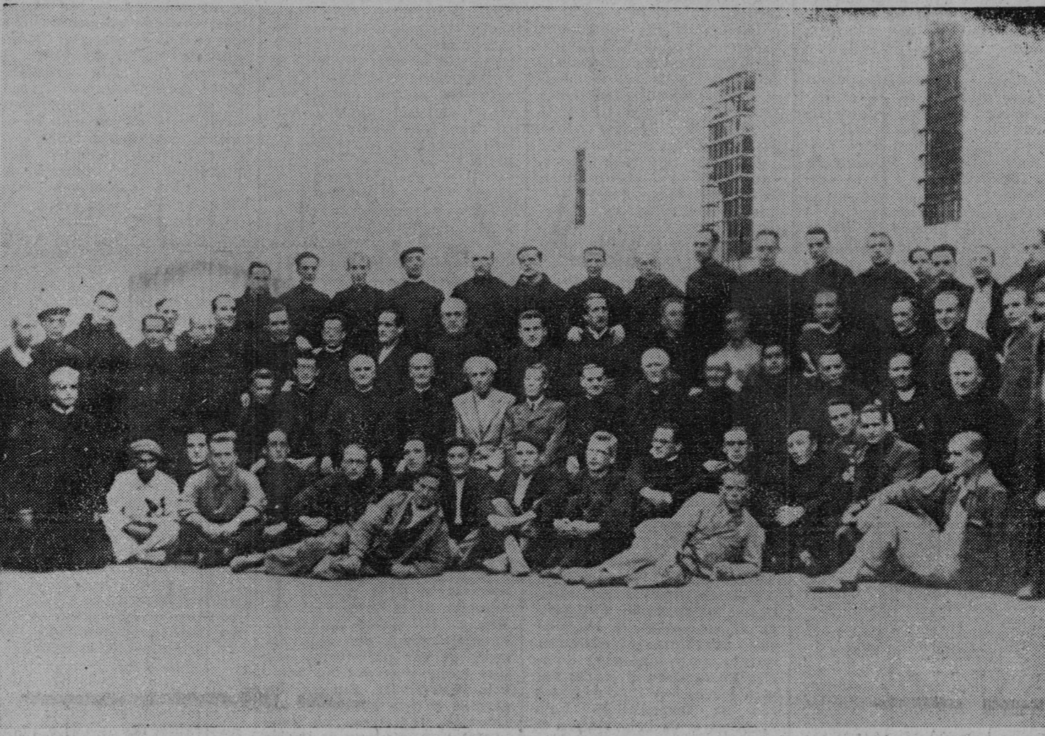
Julián Besteiro, en el pallo de la Prisión de Carmona, en el sitio de honor, rodeado de sacerdotes vascos, condenados por el falangismo, teniendo a su izquierda al Director del establecimiento, a quien destituyeron sus jefes por haber autorizado esta fotografía, donde se demuestra que Franco, al igual que hacen en Hungría o en Checoslovaquia, persigue a cuantos no se someten a su régimen de tiranía.