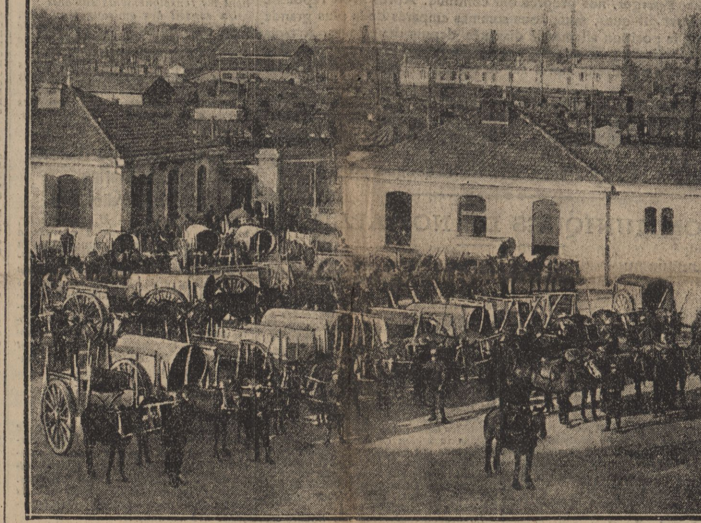
Un convoi très original vient de quitter Bordeaux. Il est composé de chars landais tirés par des vigoureux petits mules...