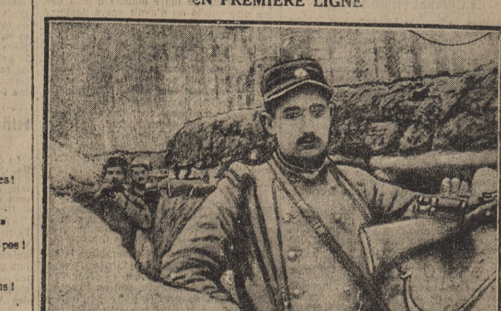
TROIS « POILUS » BORDELAIS DANS UN BOYAU