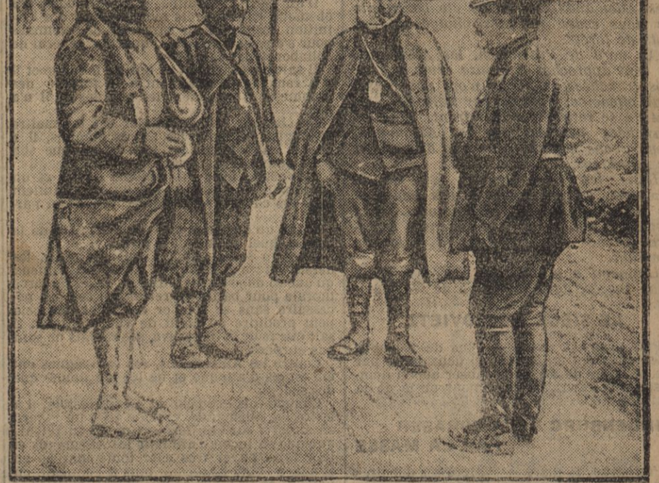
BLESSÉS FRANÇAIS PANSES PAR UN MAJOR BRITANNIQUE