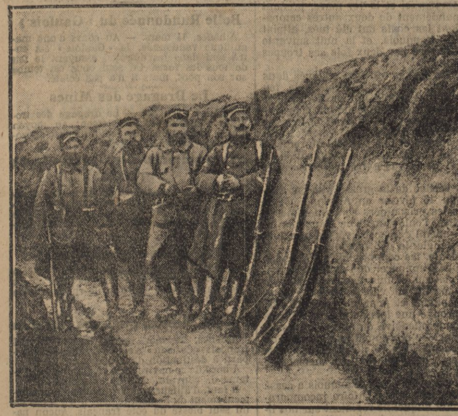
UN GROUPE DE CHARENTAIS QUI N'ONT PAS MAUVAISE MINE