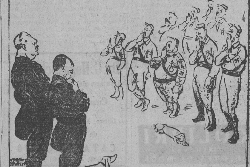
EVOLUCION DEL SALUDO NAZI, SEGUN UNA INTENCIONADA caricatura del "Morning Post", de Londres.

A CONTECIMIENTOS recientes de Alemania, y que son de pública notoriedad, han demostrado, según comentamos días pasados, que Hitler está inseguro en el poder. La dictadura fascista vacila. Esto es lo evidente. No se sabe qué fuerza dará el empujón decisivo para el derrumbe final. No se sabe con exactitud qué sector social usufructuará la caída, aunque ya lo prevemos. Pero lo indudable es que Hitler y sus hordas fieles atraviesan por una situación difícil, en primer lugar porque le ha salido al paso una resistencia poderosa, y después, porque dentro de las filas nazis hay una laxitud, un cansancio, una falta de fe crecientes.