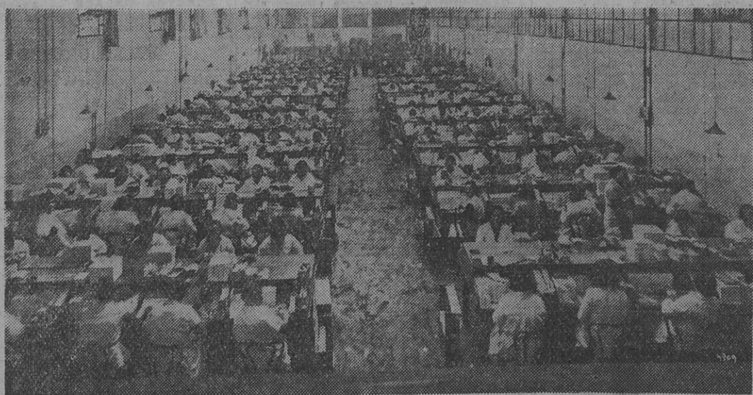
Vista de una sección del taller de empaquetado de los cigarrillos "CONDAL", con una parte del personal obrero, que otras fábricas substituyen por máquinas.

que multiplican fabulosamente las ganancias del industrial y llevan lá miseria a los hogares obreros