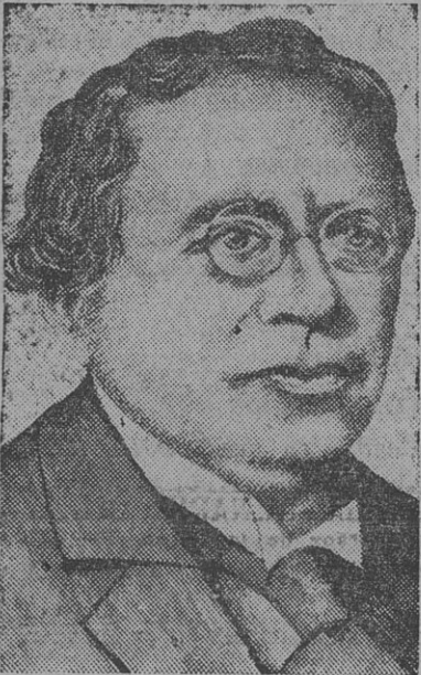
DELEGADO SOVIETICO EN GINEBRA

El primer capítulo de dicho plan se leerá esta tarde, teniéndose entendido que la delegación francesa se propone presentarle muchas enmiendas para hacer el texto más rígido.