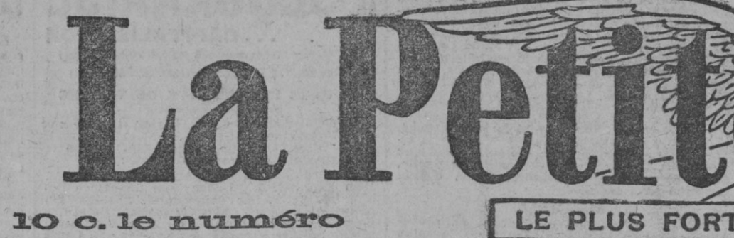
10 c. le numéro