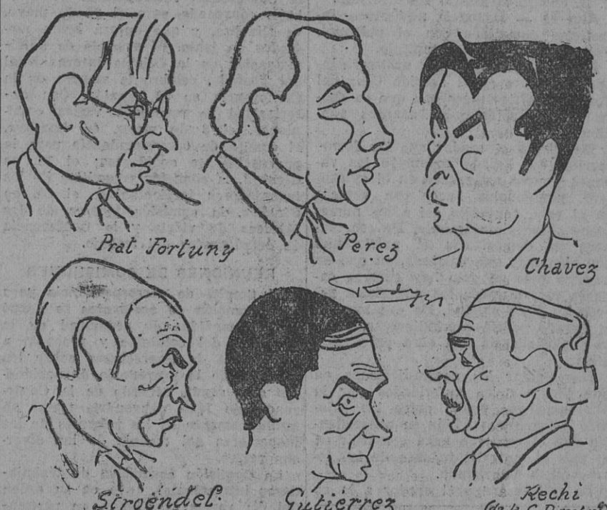
FIGURAS DEL CONGRESO DE LA UNION FERROVIARIA, por nuestro dibujante Rody

Sobre el vestuario de los guardas también reclamó la comisión directiva para que se establezca las mismas condiciones de las empresas particulares. También se interesó la comisión direc-