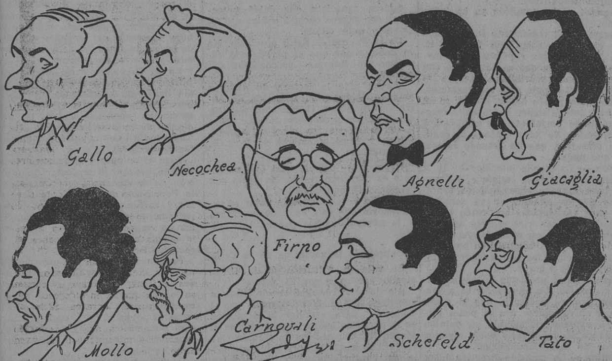
ALGUNOS MIEMBROS DE LA COMISION DIRECTIVA DE LA FRATERNIDAD, VISTOS por Rody

Historió el desarrollo de la labor realizada y las dificultades que se suscitaban con el cambio de gobierno.