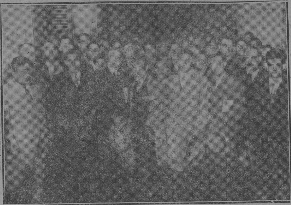
CONCURRENTES AL LUNCH DE LA UNION OBREROS MUNICIPALES

Como informamos en la crónica respectiva, la tarde de ayer fué dedicada a las demostraciones organizadas en homenaje a los delegados.