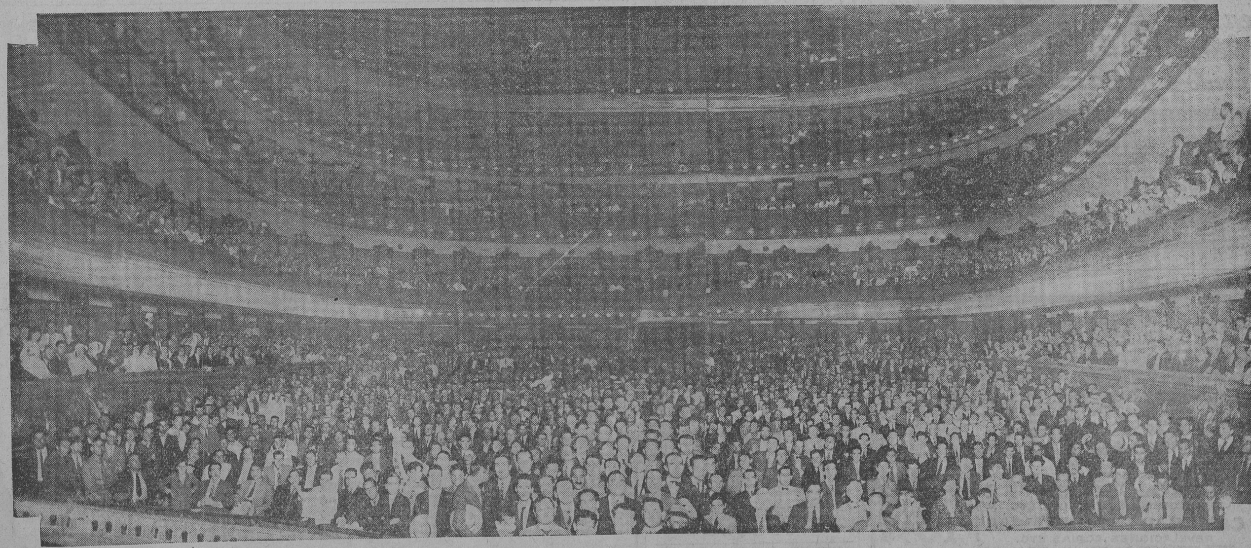
Digno cierre de la intensísima campaña electoral realizada por el Partido, resultó el acto de anoche en el teatro Coliseo. Antes de iniciarse los discursos el público había colmado la capacidad de todas las instalaciones de la amplia sala, que ofrecía el imponente aspecto que muestra la nota gráfica.