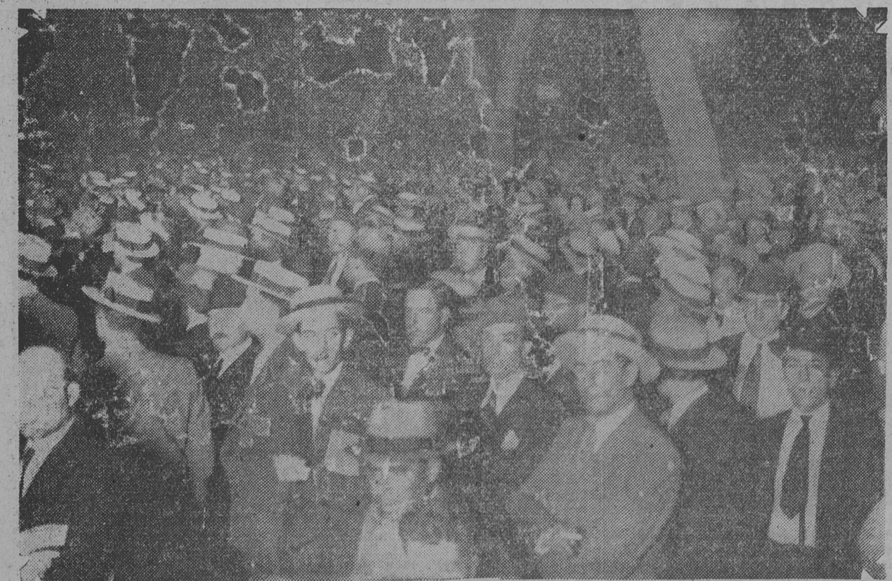
EL TEATRO COLISEO, LA PLAZA LIBERTAD Y SUS ADYACENCIAS OFRECIERON ANOCHE el imponente aspecto característico de las grandes reuniones socialistas. El público formó una masa compacta, en la calle Charcas y en el tramo comprendido entre Cerrito y Libertad.

El Comité Electoral de la sección 3a. invita a los compañeros y simpatizantes comprometidos para fiscalizar el acto electoral de mañana, a concurrir hoy después de las 20 horas, a la Casa del Pueblo, de Barracas, Alvarado 1963, para retirar los cuadernos y sus respectivos poderes, como también recibir las últimas instrucciones.