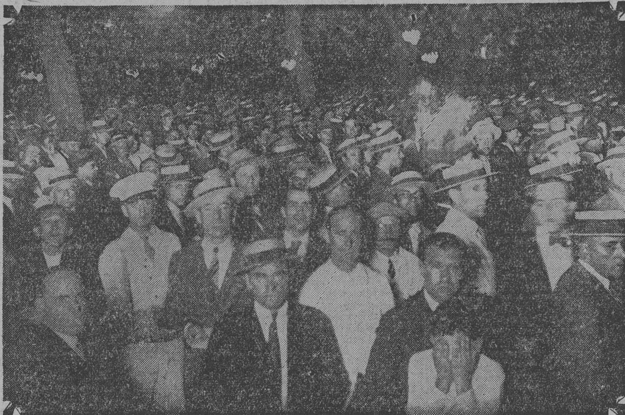
DECIDIDO EL PUEBLO A AFIRMAR SU FE INQUEBRANTABLE EN LA DEMOCRACIA Y expresar su adhesión al Socialismo, respondió entusiastamente a la convocatoria del Partido. Los poderosos altoparlantes colocados en la plaza Libertad permitieron al numeroso público escuchar la palabra de nuestros oradores.

En materia política nos reafirmamos en nuestra profunda y sincera fe democrática. No dejaremos arrebatar impunemente ninguna de las conquistas otorgadas por la ley Sáenz Peña. Lucharemos por la realización de nuestros ideales dentro del orden y de la legalidad, hasta tanto el orden y la legalidad sean las normas del estado argentino.